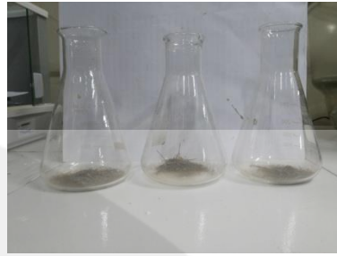
Gambar 2. Pengujian Serat Kasar