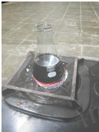
Gambar 9. Uji Serat Kasar