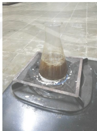
Gambar 8. Uji Serat Kasar