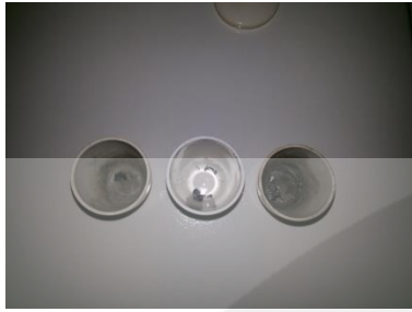
Gambar 1. Pengujian Kadar Abu