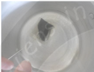
Gambar 3. Uji Keadaan Kantong