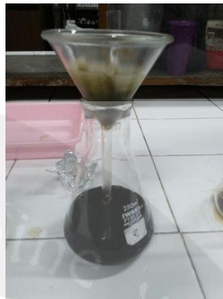
Gambar 10. Uji Serat Kasar