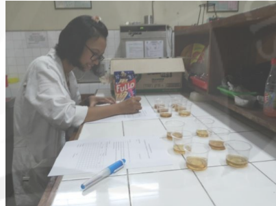
Gambar 6. Uji Organoleptik