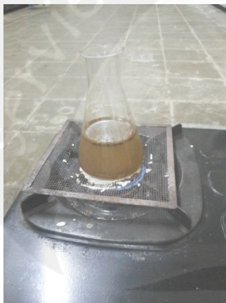
Gambar 11. Uji Serat Kasar