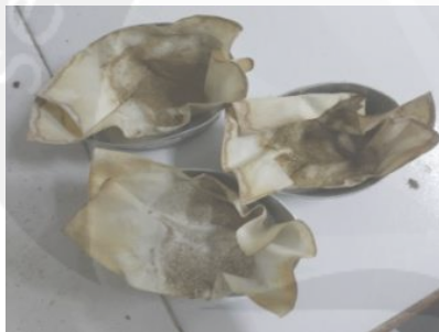
Gambar 5. Uji Serat Kasar