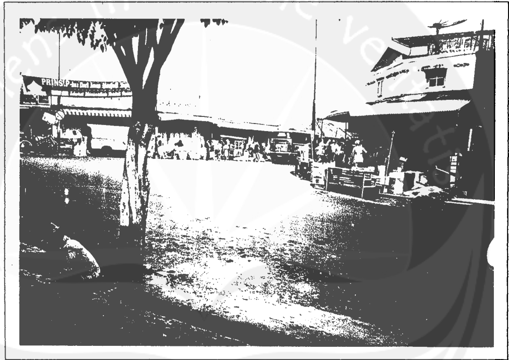
Gambar 1.2 Lokasi Pasar Parakan