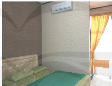
Gambar: 2.2. Kamar Wisma Kagama