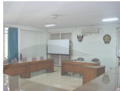
Gambar: 2.4. Ruang Nuri

Fasilitas: 20 kursi, AC, whiteboard , wireless