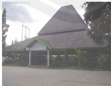
Gambar: 2.8. Pendopo Wisma Kagama -tampak depan