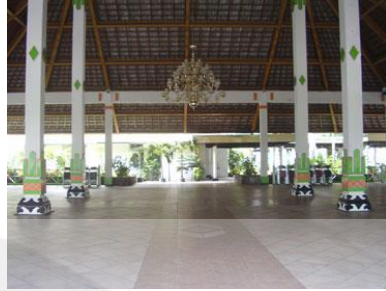
Gambar: 2.9. Pendopo Wisma Kagama -tampak dalam