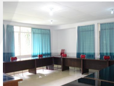
Gambar: 2.5. Ruang Kenari

Fasilitas: 20 kursi, AC, whiteboard , wireless