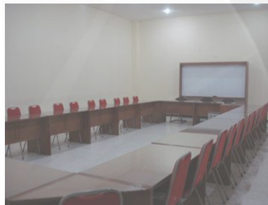
Gambar: 2.7. Ruang Cendrawasih

Fasilitas: 35 kursi, AC, whiteboard , wireless