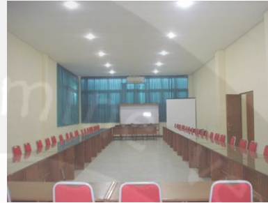
Gambar: 2.3. Ruang Rajawali

Fasilitas: 55 kursi, whiteboard , wireless