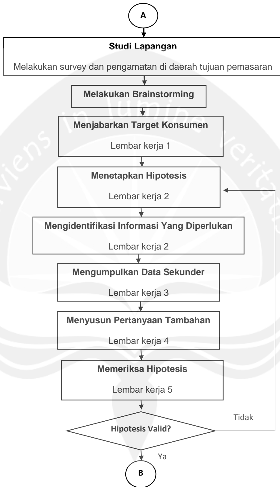
Gambar 3.1 Lanjutan