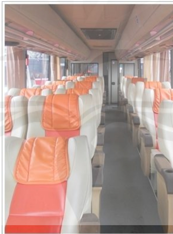
Gambar 1.4 Tampak dalam bus DAMRI Royal

Royal Bus Damri. Bahkan Royal Bus Damri hanya bisa dijumpai di Kalimantan Barat saja. Armada eksklusif ini mempunyai kapasitas dan fasilitas yang berbeda dengan jenis armada Damri yang eksekutif. Kapasitas tempat duduknya lebih sedikit dengan formasi 1-2, satu baris terdiri dari satu tempat duduk tunggal dan 2 tempat duduk double, berkapasitasnya 29 penumpang. Kursinya lebih lebar dan nyaman dan disediakan selimut untuk tidur karena di bagian atasnya ada semacam pembatas untuk kepala sehingga penumpang bisa nyaman walaupun melewati jalan Kalimantan yang terkenal rusak dan banyak berlubang. Di dalam bus disediakan juga wifi gratis. Setiap perjalanan ada dua sopir yang menjalankan bis secara bergantian, sehingga mengurangi resiko kecelakaan karena mengantuk.