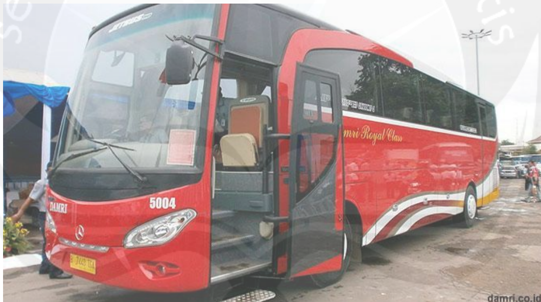
Gambar 1.3 Angkutan Umum Bus DAMRI

Transportasi yang difasilitasi dengan ac, toilet, bantal, selimut, tv, dvd, dan sebagainya tentu akan memberikan kenyamanan bagi para pengguna jasa transportasi. Dengan meningkatnya persaingan, perusahaan transportasi bus berlomba-lomba untuk mengembangkan fasilitas yang lebih unggul dibanding dengan armada bus lainnya. Adapun pesaing – pesaing dari Bus DAMRI adalah Bus ATS, Bus Mudah, Bus Trans Borneo dan sebagainya. Berbagai macam armada bus mempunyai keunggulan tersendiri dari segi harga, fasilitas, dan kenyamanan. Namun angkutan umum DAMRI juga mempunyai fasilitas yang tidak kalah bagus dari bus lainnya.