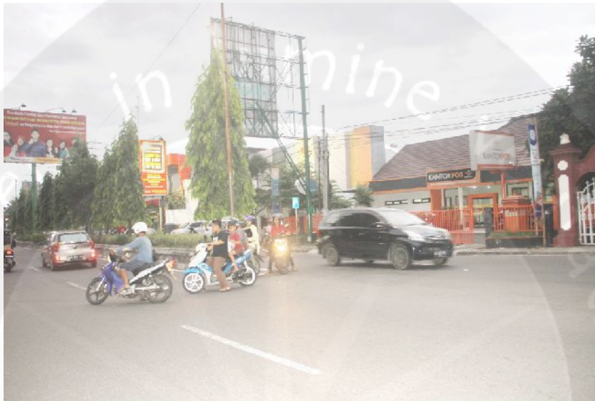
FOTO-FOTO SITUASI DAN KONDISI LOKASI PENELITIAN