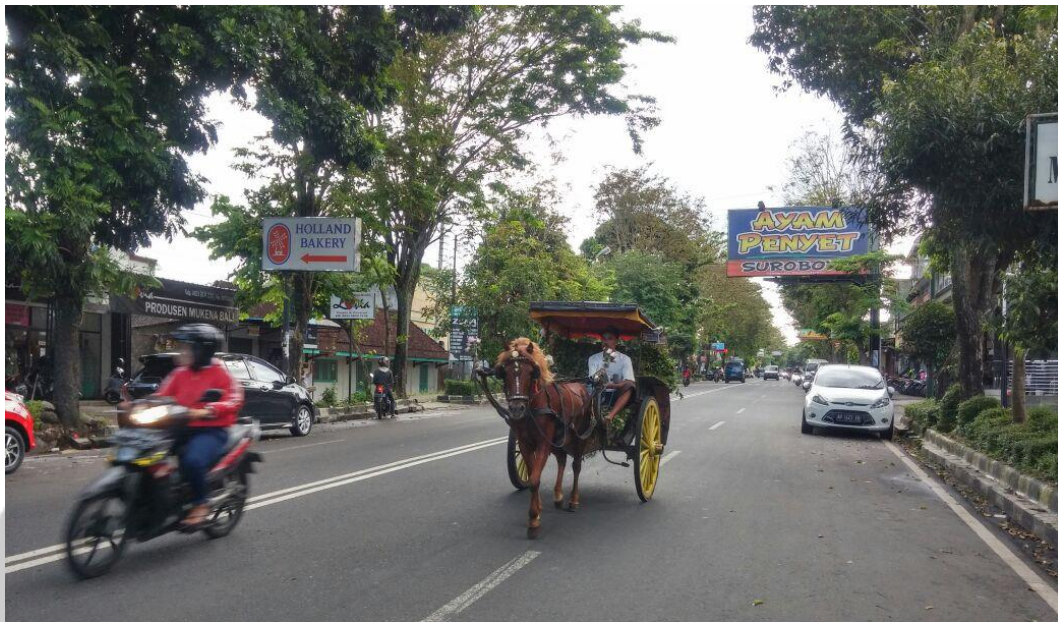
Gambar 7. Kendaraan lambat di ruas Jalan Pandanaran