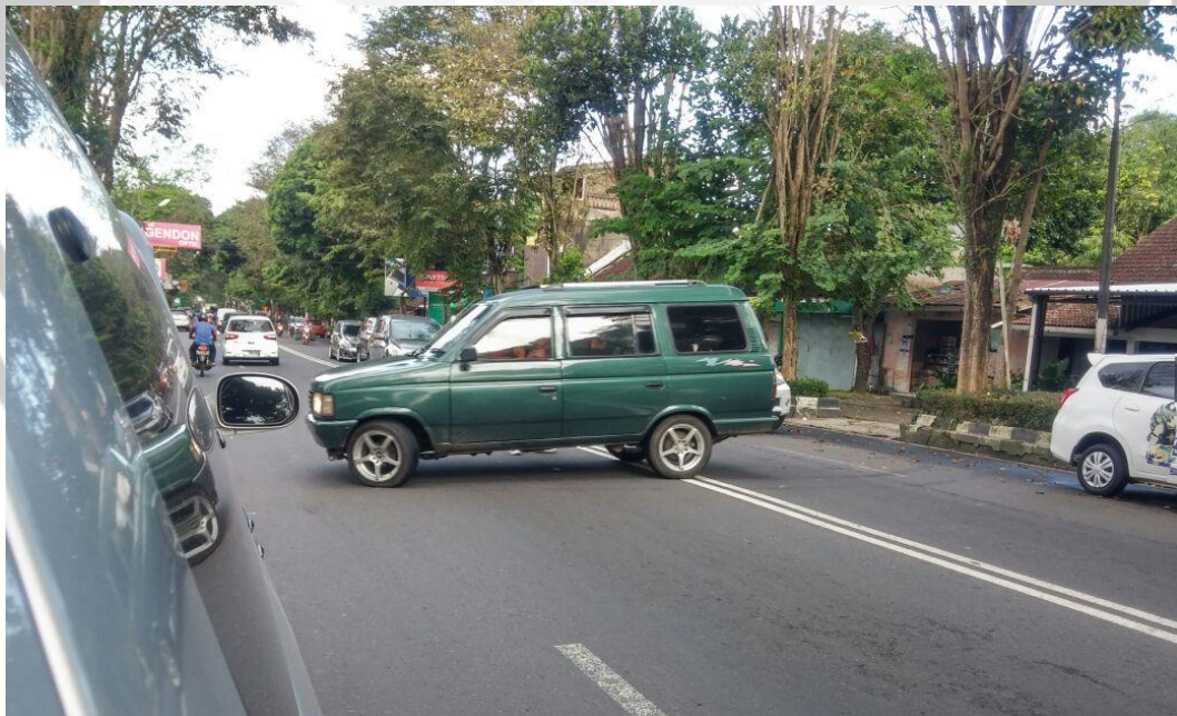
Gambar 8. Kendaraan keluar masuk di sisi jalan