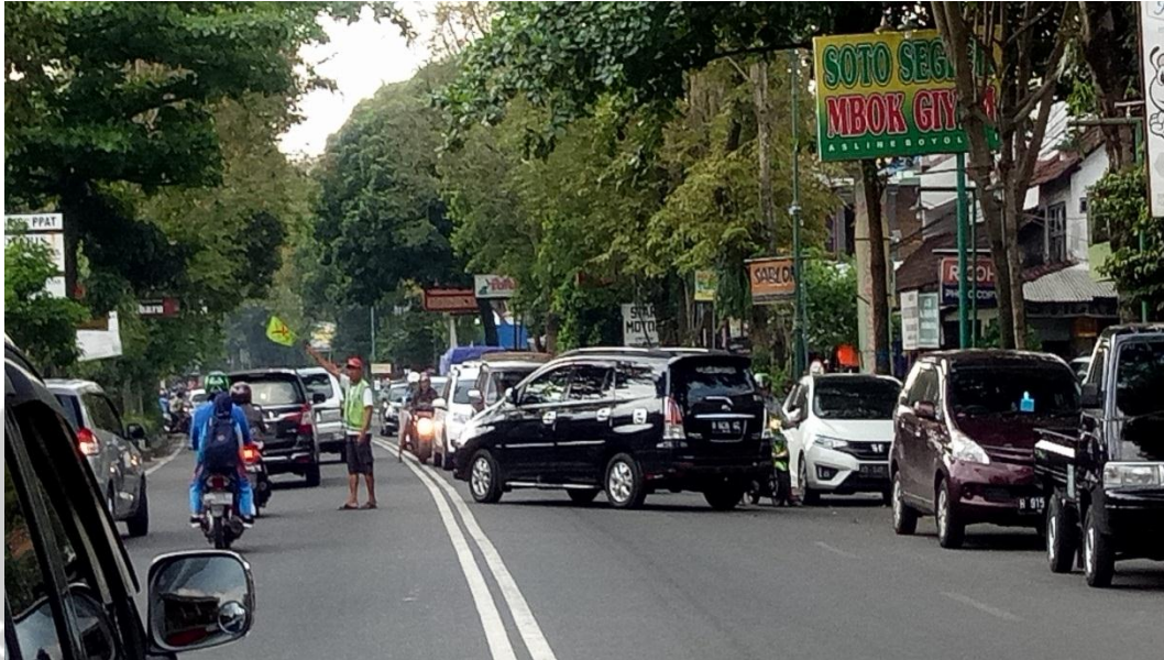
Gambar 9. Kendaraan masuk dari sisi jalan