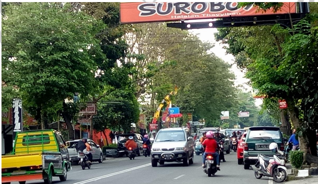
Gambar 2. Kondisi arus lalu lintas pada siang hari