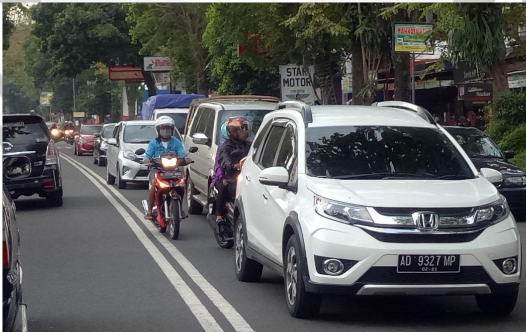
Gambar 10. Antrian kendaraan akibat kendaraan masuk dari sisi jalan