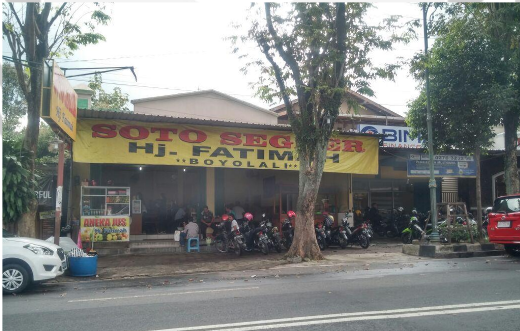
Gambar 6. Parkir motor di trotoar