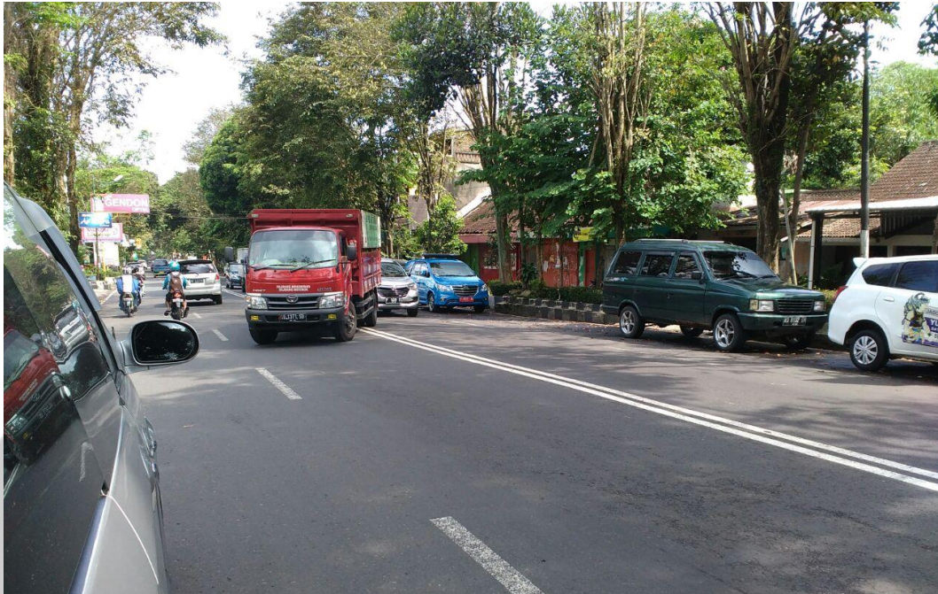
Gambar 5. Kendaraan berat keluar ke sisi jalan