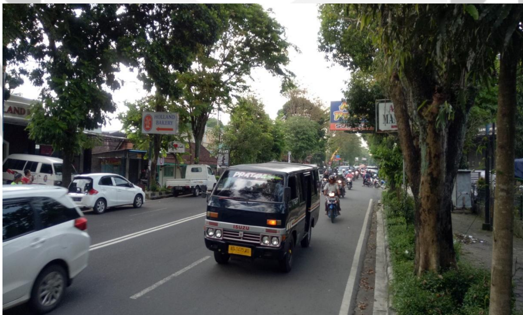
Gambar 8. Kendaraan umum di ruas Jalan Pandanaran