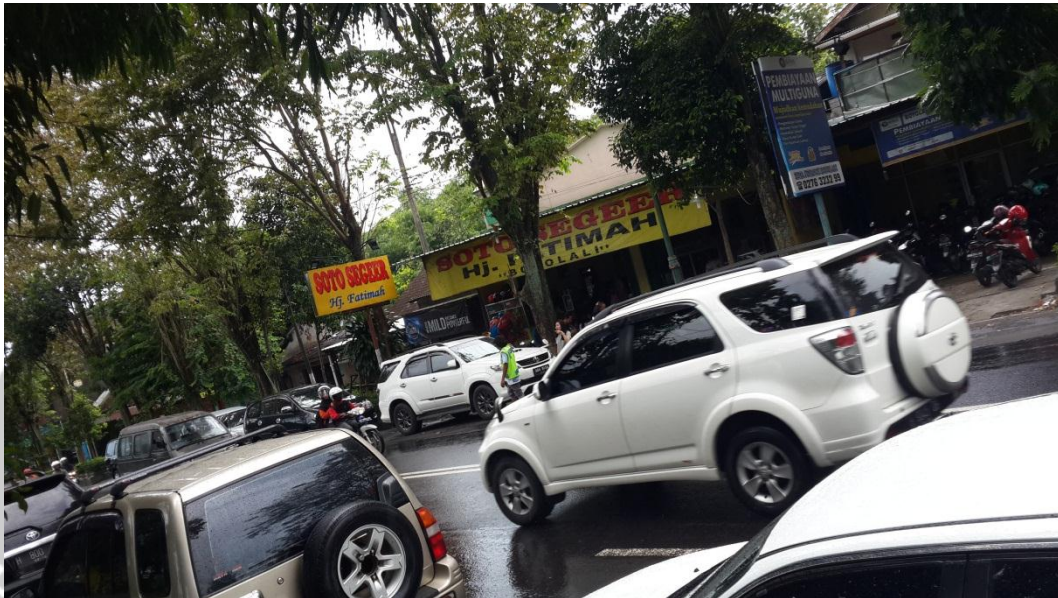
Gambar 3. Kondisi arus lalu lintas pada sore hari