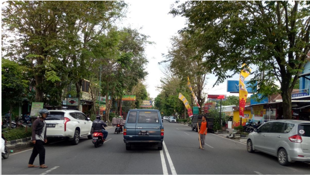
Gambar 7. Penyeberang jalan yang mengganggu laju kendaraan