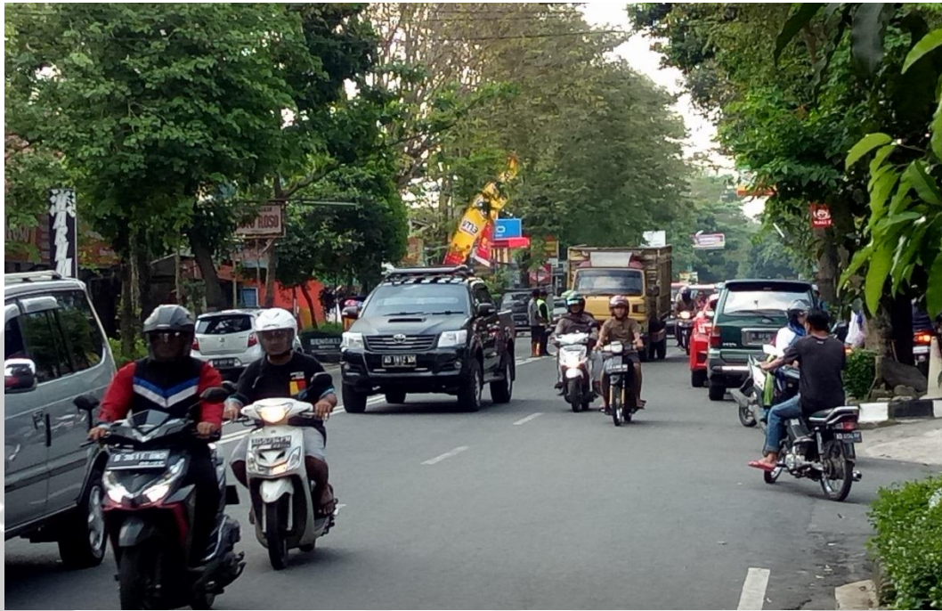
Gambar 1. Kondisi arus lalu lintas pada pagi hari