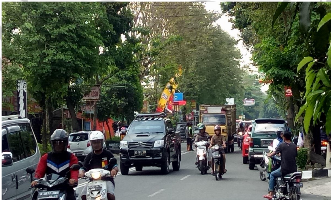
Gambar 4. Kendaraan berat yang melintasi ruas Jalan Pandanaran