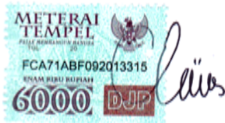
Clara Ima Fitria