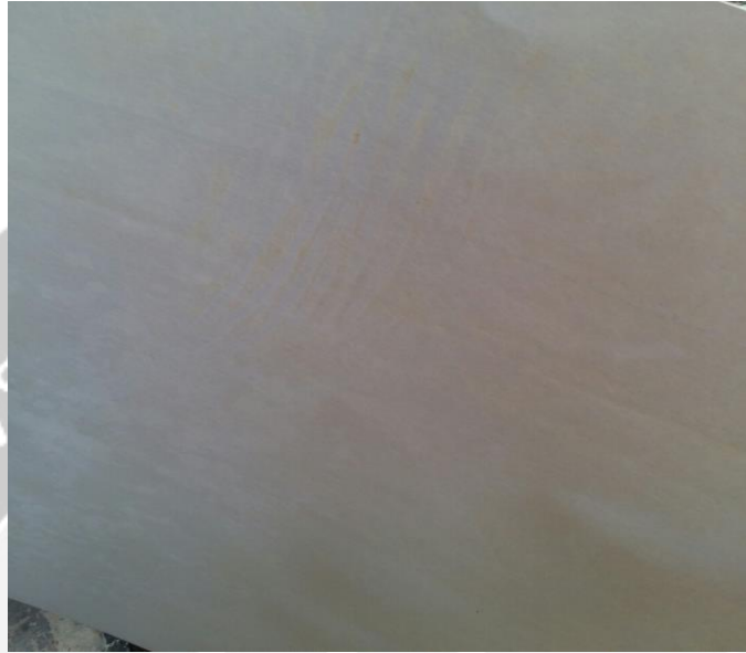
Gambar 1. Kertas Rusak 1