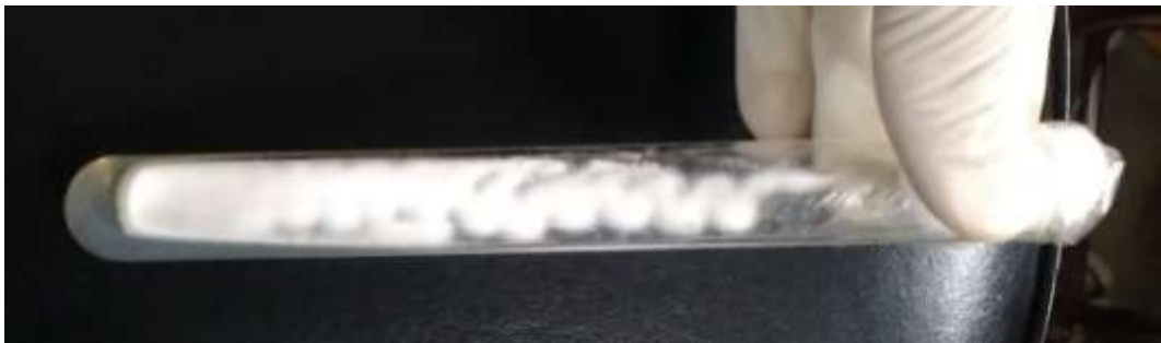
Gambar 1. Koloni Beauveria bassiana pada medium PDA (dokumentasi pribadi, 2016)

pewarnaan laktofenol biru dapat terlihat hifa yang bersekat-sekat dan konidiofor dari Beauveria bassiana yang dapat dilihat pada Gambar 2, hasil ini sesuai dengan teori menurut Rosmini dan Lasmini (2010), bahwa Beauveria bassiana merupakan jamur mikroskopik yang berbentuk hifa, kemudian hifa-hifa membentuk koloni yang disebut miselia, serta teori menurut Mudrončková dkk. (2013), bahwa ujung hifa Beauveria bassiana akan membentuk konidiofor yang menghasilkan konidia.