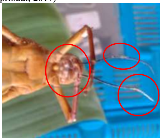
Gambar 5. Infeksi Beauveria bassiana pada mulut dan antena belalang kayu (dokumentasi pribadi, 2017)