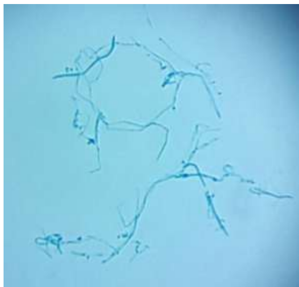
Gambar 2. Beauveria bassiana dengan pewarnaan laktofenol biru (dokumentasi pribadi, 2016)