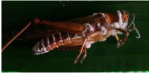
Gambar 6. Infeksi Beauveria bassiana terhadap belalang kayu (dokumentasi pribadi, 2017)

Beauveria bassiana dapat menginfeksi serangga melalui perlekatan konidia pada kutikula serangga, trakea, dan juga lewat saluran pencernaan apabila Beauveria bassiana termakan oleh serangga inang. Setelah melekat pada kutikula serangga, konidia Beauveria bassiana dapat berkecambah apabila kondisi kelembapan dan suhu di sekitar konidia sesuai. Setelah melekat pada kutikula serangga dan berkecambah, Beauveria bassiana mengeluarkan enzim protease, kitinase, dan lipase untuk menembus kutikula serangga. Setelah berhasil menembus kutikula serangga, Beauveria bassiana akan menyerang haemocoel dan berkembang biak baik dengan blastospora maupun pertumbuhan hifa (Jaronski dan Goettel, 1997). Beauveria bassiana juga memproduksi beberapa jenis toksin seperti beauvericin , beauverolide , bassianolide , bassiacridin , dan asam oksalit yang menyebabkan kematian sel serangga (Zimmermann, 2007). Serangga inang akan mati akibat dari kekurangan nutrisi, paparan racun, dan desikasi (Feng dkk., 1994; Mudrončková dkk., 2013). Apabila kelembapan lingkungan tinggi, miselium Beauveria bassiana akan menembus keluar tubuh serangga dan akan memproduksi konidia (Feng dkk., 1994; Jaronski dan Goettel, 1997).