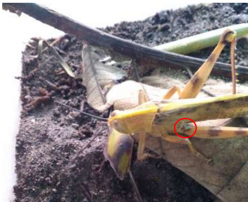
Gambar 4. Beauveria bassiana pada coxa belalang kayu (dokumentasi pribadi, 2017)

kayu, maupun pada bagian-bagian tertentu tubuh belalang kayu seperti bagian coxa , mulut, dan segmen antena belalang kayu yang dapat dilihat pada Gambar 4, Gambar 5, dan Gambar 6. Pertumbuhan Beauveria bassiana pada bagian coxa , mulut, dan segmen antena belalang dapat diakibatkan pada bagian tersebut memiliki daerah yang lebih lunak dan lebih mudah ditembus oleh miselium apabila dibandingkan dengan bagian tubuh lainnya.