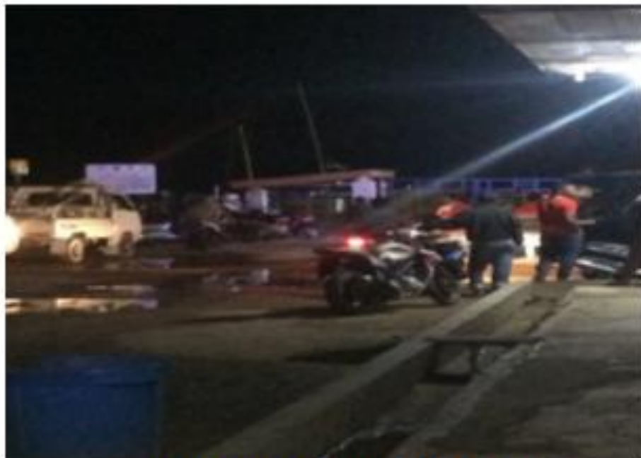
Gambar 4. Kendaraan yang Parkir Pada Malam Hari