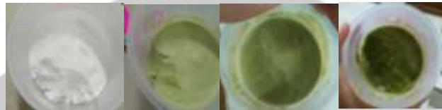
Gambar 1. Perbandingan Warna Produk Es Puter dengan Penambahan Ekstrak Daun Cincau Hijau Pohon

cincau hijau pohon berwarna hijau. Ekstrak daun cincau hijau pohon yang ditambahkan pada es puter mengandung senyawa klorofil yang berperan memberikan warna hijau pada daun dan juga dapat memberikan warna hijau pada makanan (Sunanto, 1995).