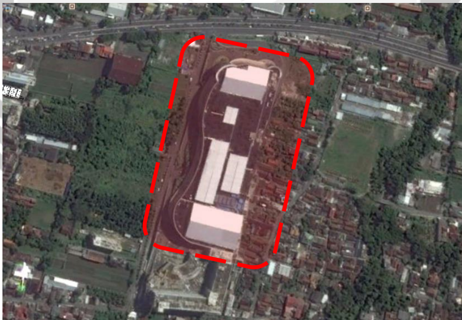
Gambar 1.2. Lokasi Mall Hartono Lifestyle Yogyakarta