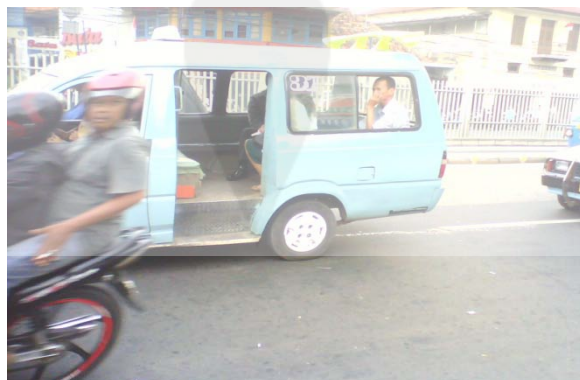
Gambar 5.7 Mikrolet Yang Rerata Hanya Mengangkut 4 Penumpang