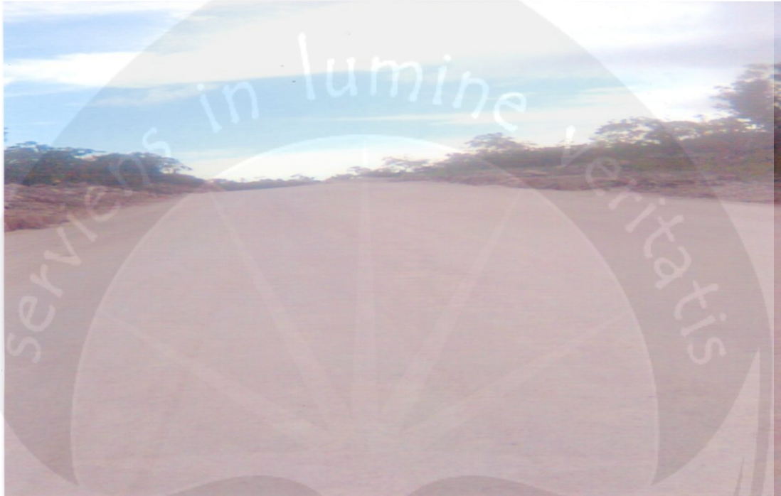
Gambar 1.1 Jalan Menuju Pantai Ngursardanan (Ohoiilir)