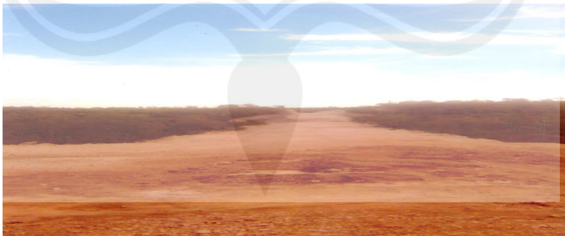
Gambar 1.2 Jalan Menuju Pantai Ngurbloat (Pasir Panjang)