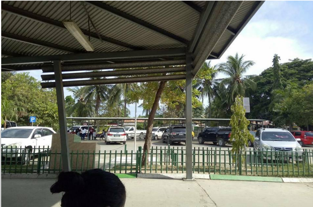
Gambar L3.1 Areal Parkir Mobil