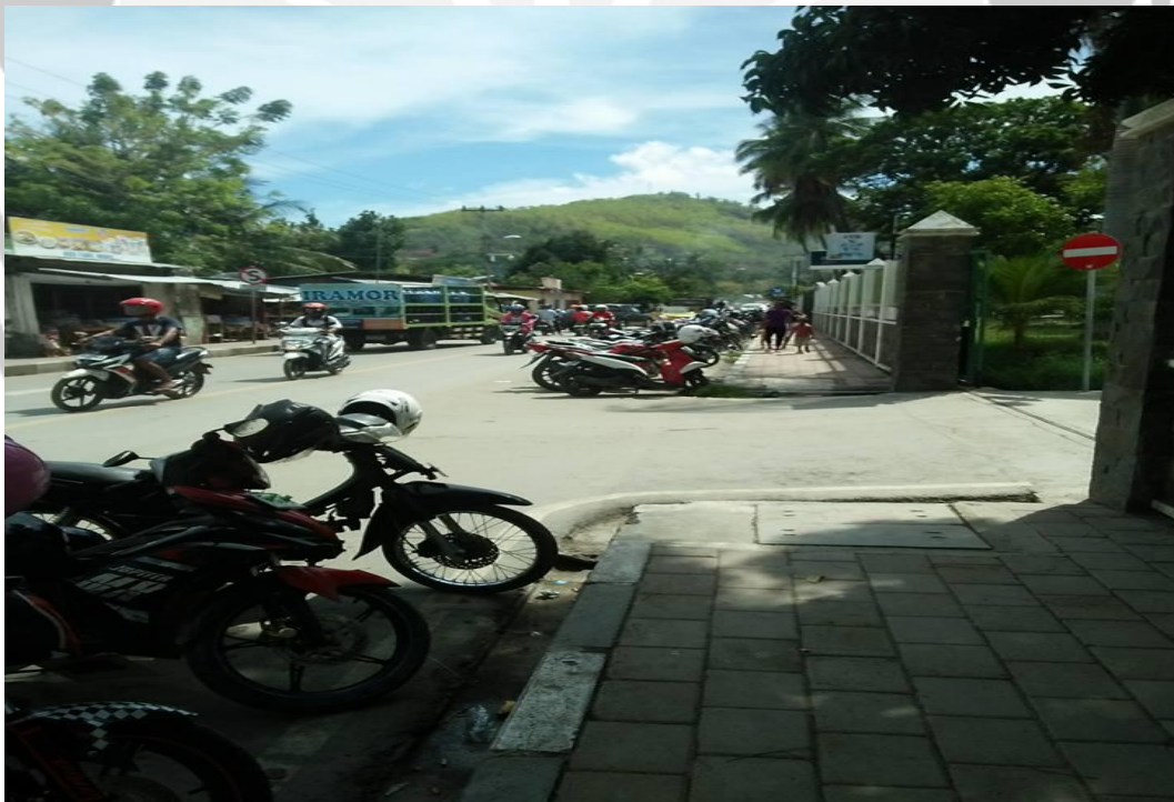
Gambar L3.4 Pintu Keluar Areal Parkir Mobil Dan Sepeda Motor