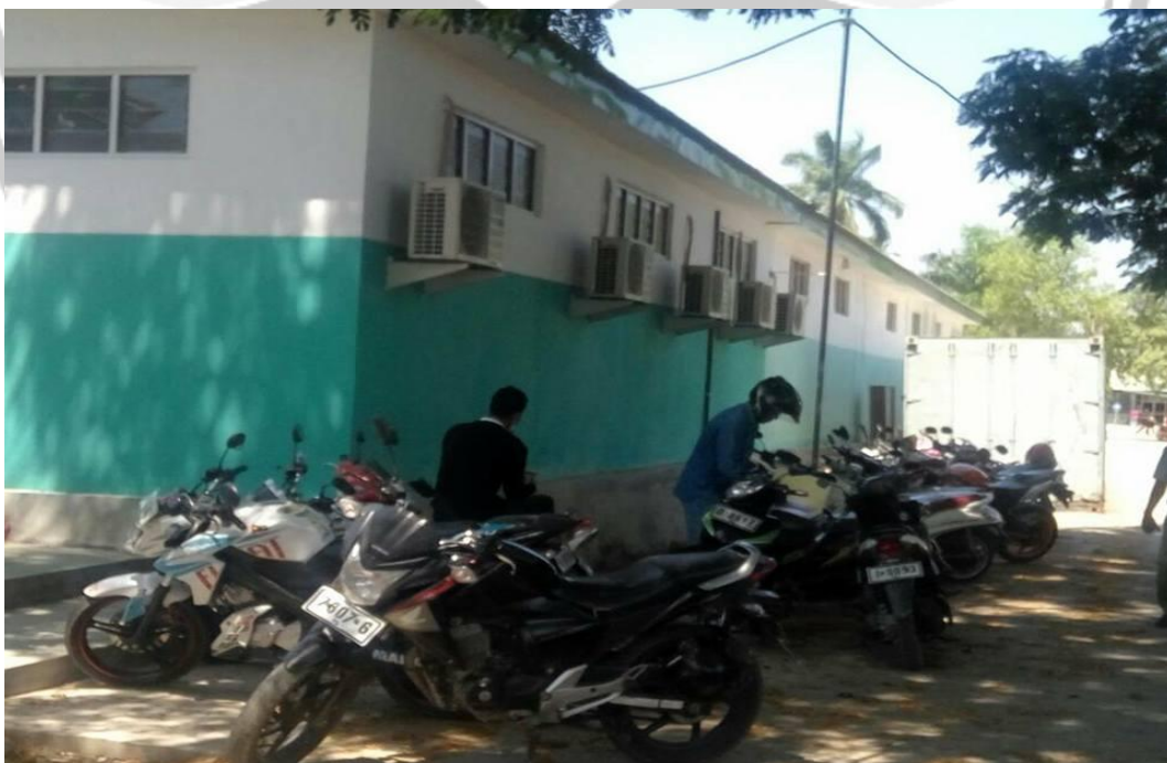
Gambar L3.2 Areal Parkir Sepeda Motor