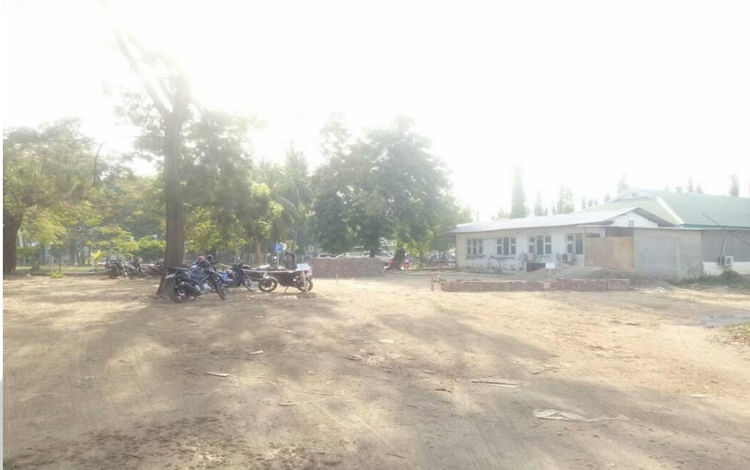
Gambar L3.5 Lahan Parkir di Sisi Selatan Rumah Sakit Yang Belum Dimanfaatkan Secara Maksimal