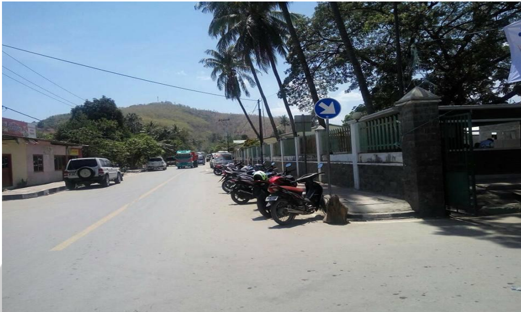
Gambar L3.3 Pintu Masuk Areal Parkir Mobil Dan Sepeda Motor