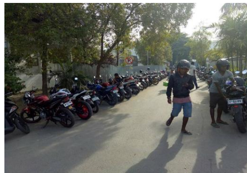
Gambar L3.6 Pengunjung Menggunakan Bahu Jalan Sebagai Lahan Parkir Kendaraan Mobil dan Motor