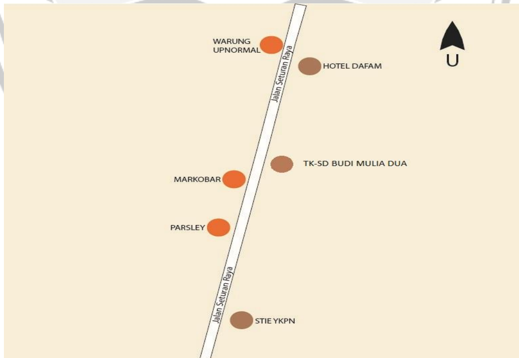
Gambar 1.2. Denah Lokasi Penelitian