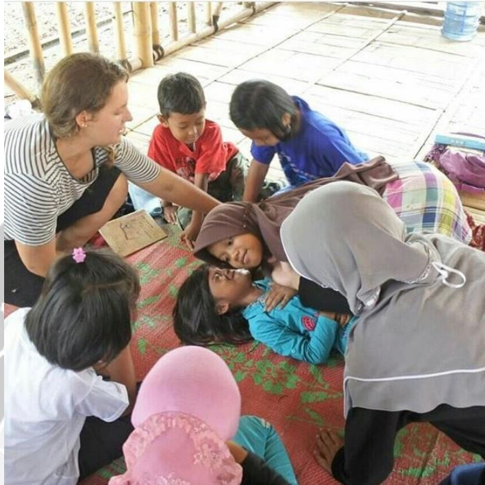
Gambar 3. Kegiatan Sekolah Pantai Pacitan