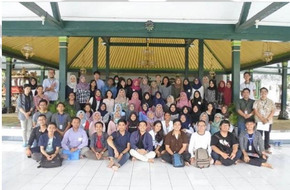
Gambar 2. Kegiatan Training Sukarelawan Batch 26