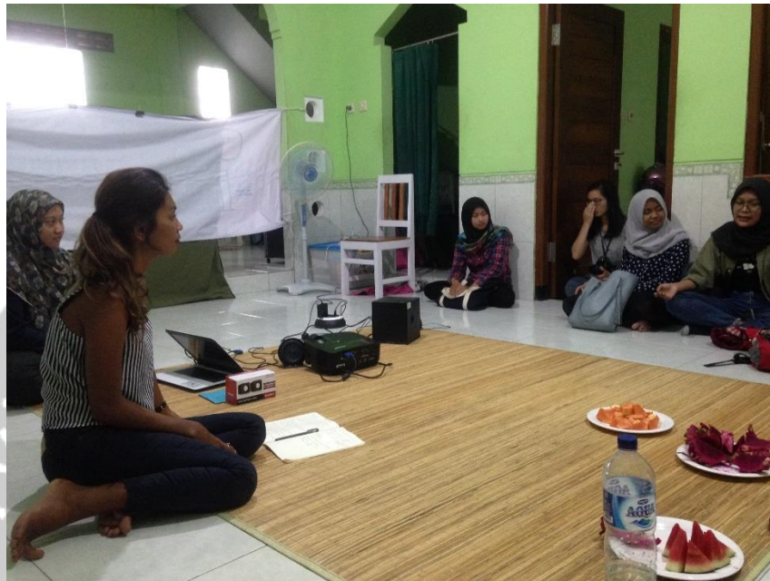
Gambar 1. Kegiatan Training Ocean Conservacy