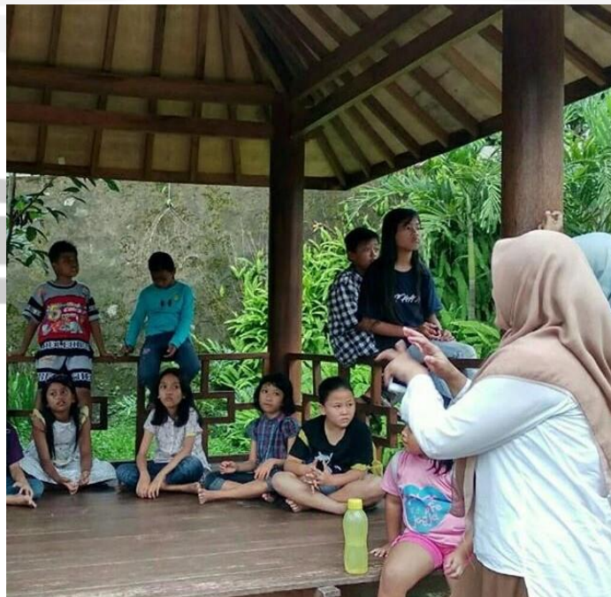
Gambar 4. Kegiatan Sekolah Sungai Code