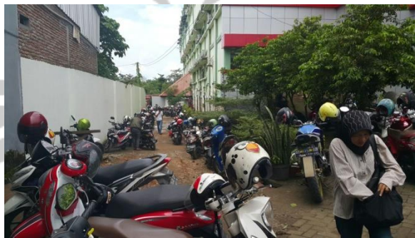
Gambar 1.2. Keadaan Parkir Sepeda Motor di Area Parkir Rumah Sakit