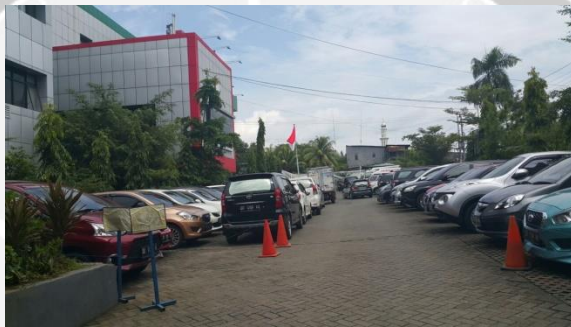
Gambar 1.1. Keadaan Parkir Mobil di Area Parkir Rumah Sakit

area ruang parkir dibanding dengan jumlah kendaraan yang memerlukan tempat parkir, oleh sebab itu sebagian pengendara memilih memarkirkan kendaraan di tepi jalan raya seputar kawasan rumah sakit, sehingga menyebabkan kesemrawutan dan sering mengakibatkan terjadi kemacetan di sekitar area rumah sakit. Dengan adanya permasalahan tersebut diperlukan analisis, penataan ulang areal parkir untuk menghindari parkir sembarangan dan menentukan langkah mengoptimalkan pengoperasian parkir.