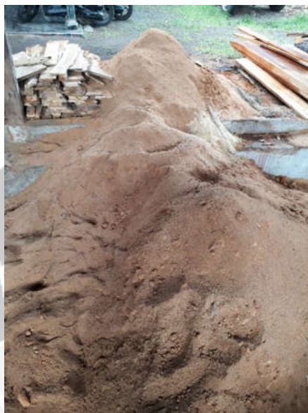
Serbuk Kayu Hasil Pematangan Kayu