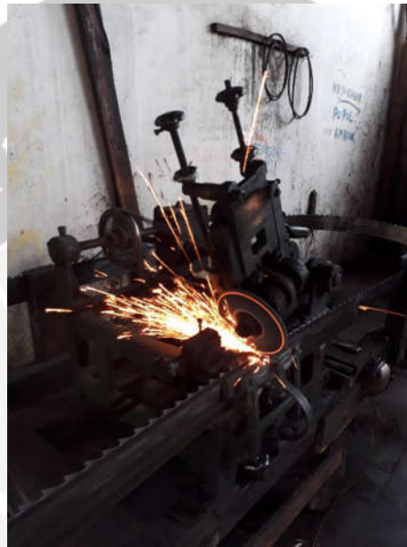
Proses Penajaman Mata Gergaji