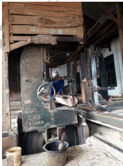
Proses Pematangan Kayu