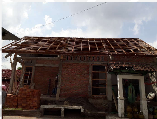
Rangka Atap Kayu Ruko 36 m 2