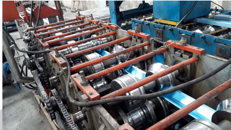
Mesin Pembentuk dan Pemotong Baja Ringan