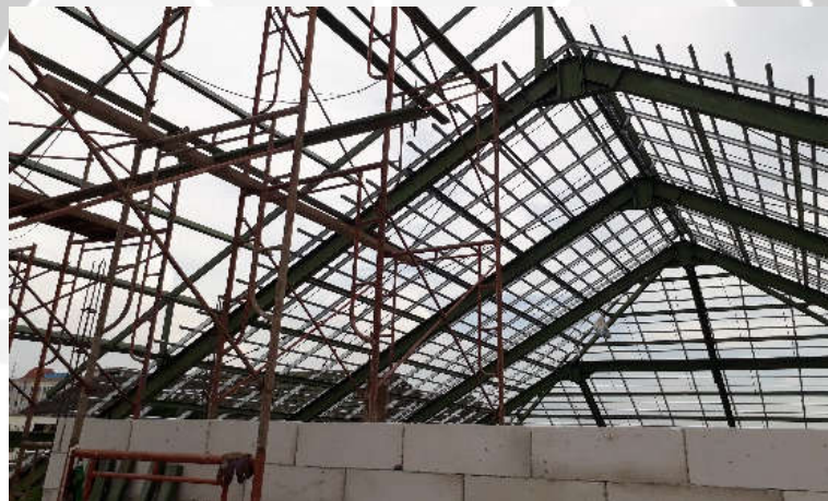
Rangka Atap Dormitory BATAN