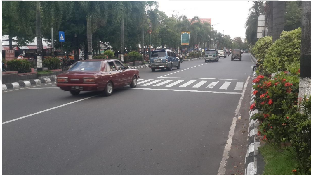
Gambar 1.2 Lokasi Jalan Pemuda, Klaten, Jawa Tengah