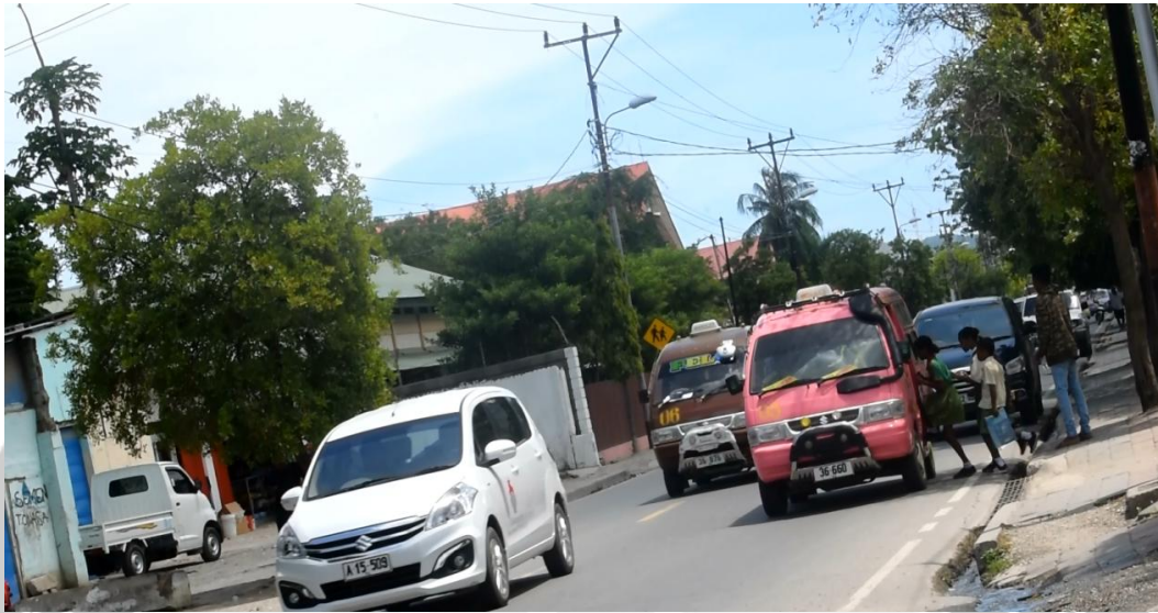
Gambar 5. Angkutan umum menaikan penumpang di pinggir jalan