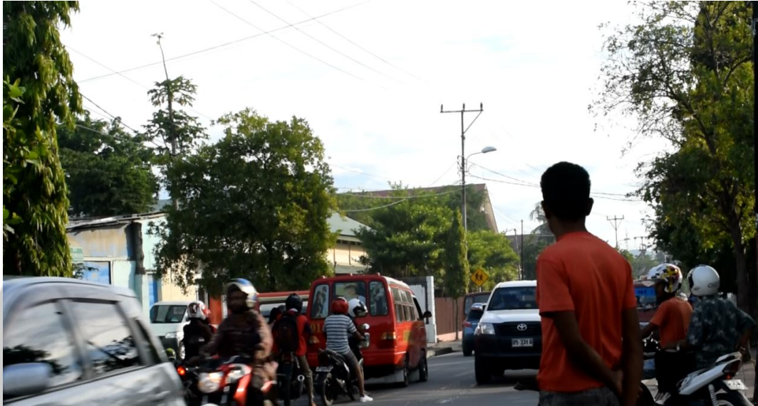
Gambar 7. Kondisi jalan saat pagi