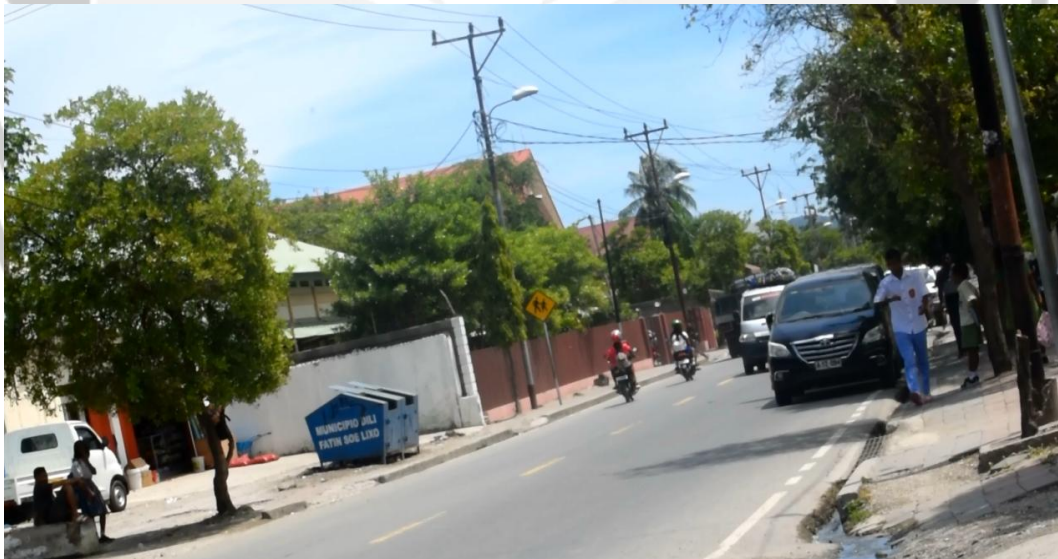
Gambar 2. Kendaraan mobil parkir di sisi jalan