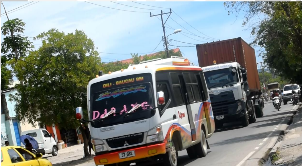
Gambar 6. Kendaraan berat bawah kontainer