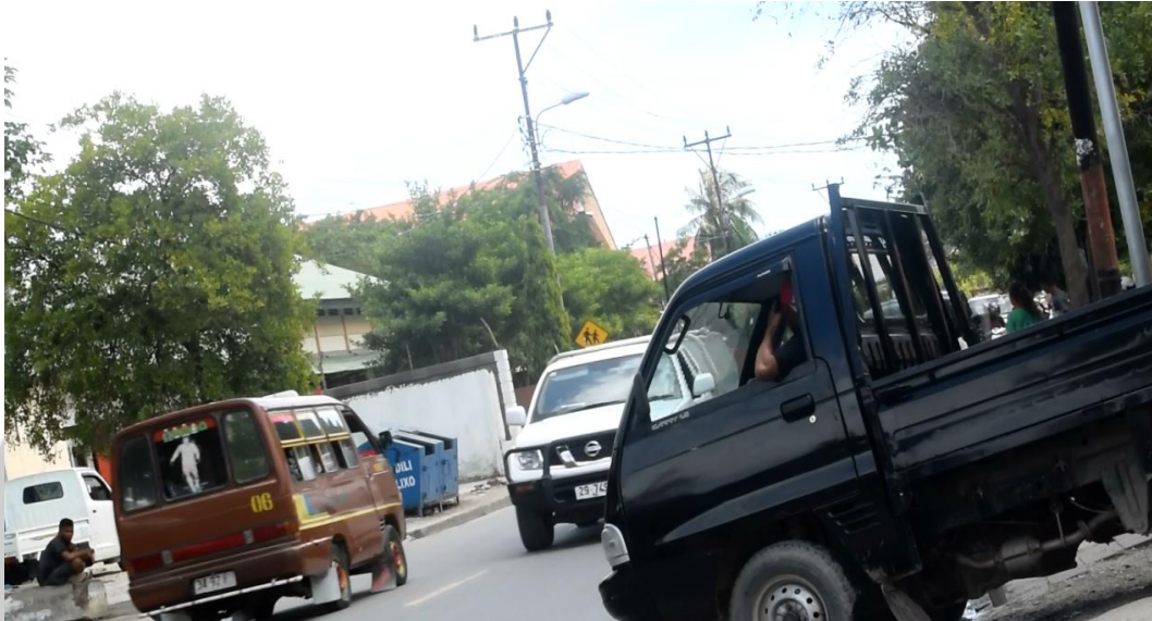
Gambar 3. Kendaraan mobil keluar masuk sisi jalan