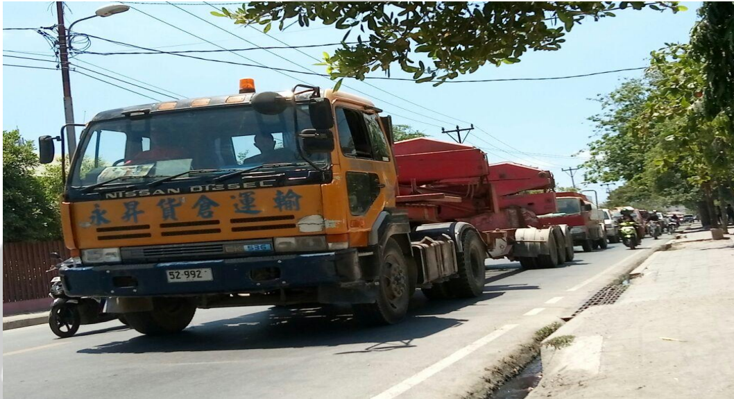
Gambar 1. Kendaraan berat