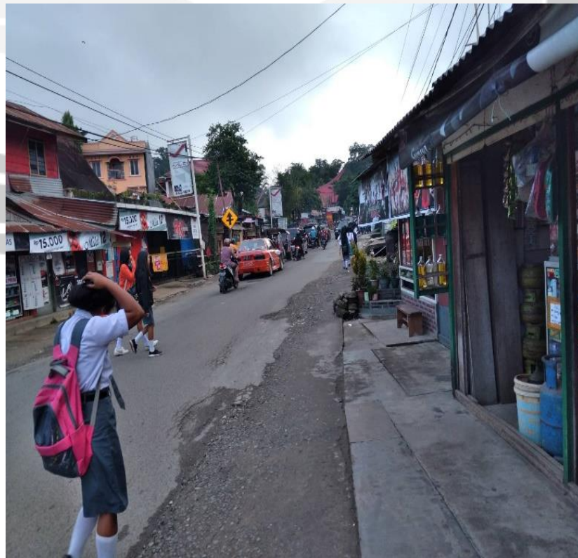
Gambar L.2. Pengambilan Data Volume Kendaraan di Lapangan