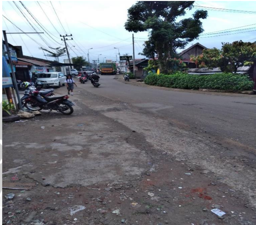
Gambar L.3. Pengambilan Data Kecepatan di Lapangan