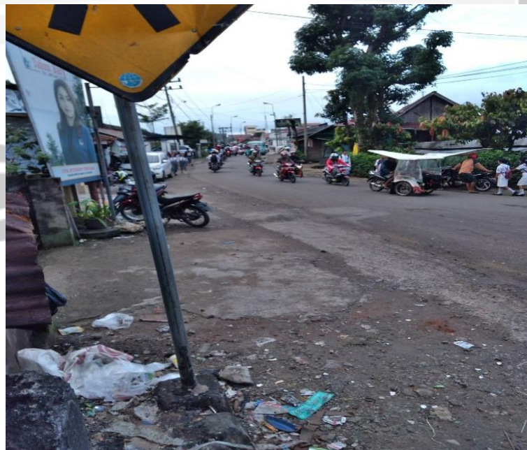
Gambar L.4. Pengambilan Data Hambatan Samping di Lapangan