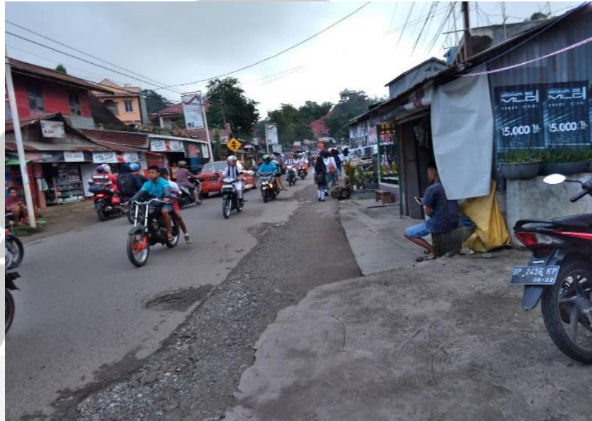
Gambar L.1. Pengambilan Data Volume Kendaraan di Lapangan