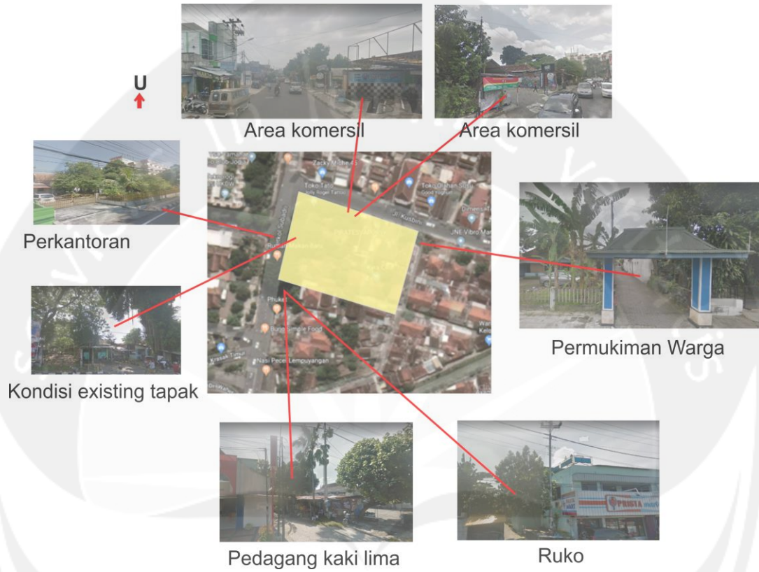
Gambar 18 Kondisi Existing Tapak