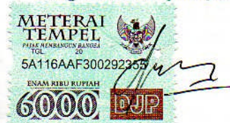
EP. Dewi Trikurniawati