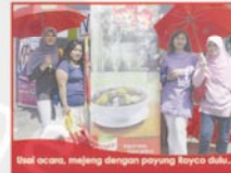
Di saat acara, mejeng dengan payung Royco dulu...

Kue Coklat Kukus, dan Es Merah Segar. Selain itu tentu saja, ibu-ibu juga mendapat aneka tips yang bermanfaat.