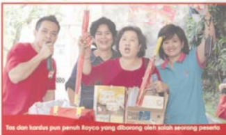
Tas dan kardus pun penuh Royco yang diborong oleh salah seorang peserta

Matahari cukup menyengat. Semangat ibu-ibu di Perumahan Bojong Depok Baru 2, Cibinong tetap tak kendur selama mengikuti Acara Berbagi Kreasi Bersama Mova yang disponsori Royco yang berlangsung hari Minggu (24/5) hingga usai.