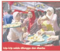
icip-icip sebelum dibungkus dan dibawa