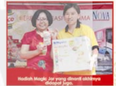
Hadiah Magic Jar yang dibagikan olehnya kepada juri.

Sebagai penutup acara, panitia membagikan seluruh door prize kepada peserta. Dan bagi yang