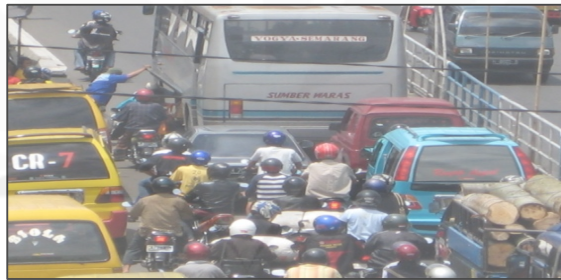
Gambar 1.1 Kendaraan Umum Menaikan Penumpang di Tengah Jalan Sehingga Menimbulkan Kemacetan

Banyaknya para pedagang yang menggelar barang dagangannya di bahu jalan sehingga membuat ruas jalan menjadi menyempit. Diperparah lagi para tukang becak yang memarkirkan becaknya di badan jalan waktu menunggu penumpang.