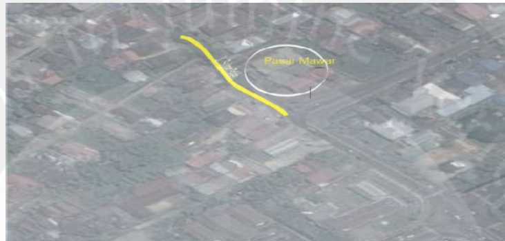
Gambar 1.3. Peta Lokasi Penelitian Pada Ruas Jalan Sultan Saleh

Manfaat yang dapat diambil dari penelitian ini adalah memberikan masukan tentang hasil kajian berupa kondisi lalu lintas di lokasi kepada instansi terkait untuk penanganan operasional ruas Jalan Sultan Saleh Pontianak.