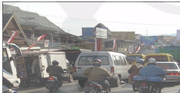
Gambar 1.2. Kegiatan Bongkar Muat Barang Dilakukan Pada Badan Jalan yang Menimbulkan Kemacetan