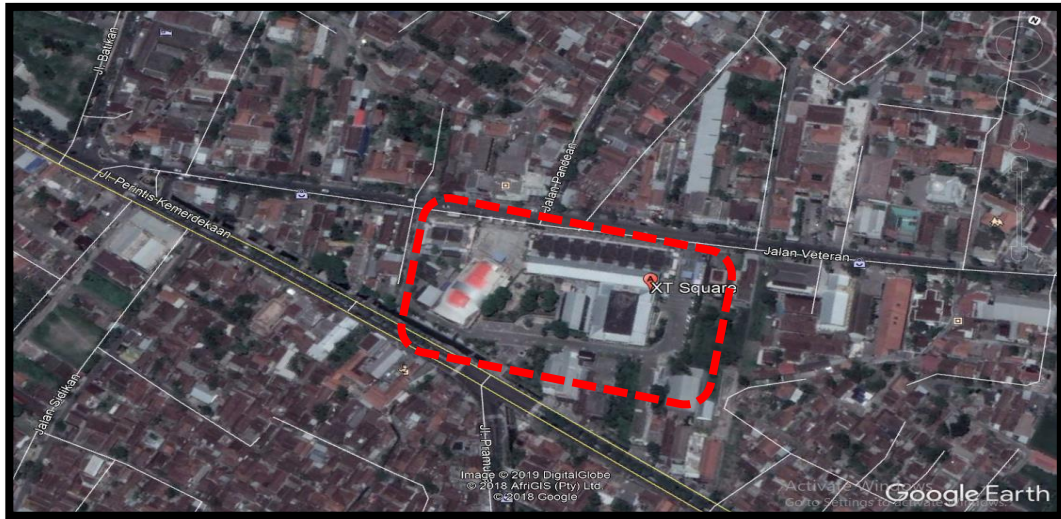
Gambar 1.1 Lokasi XT Square Yogyakarta

Lokasi penelitian yang akan dilakukan ini berada di XT Square kota Yogyakarta, Daerah Istimewa Yogyakarta.