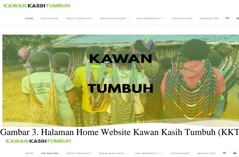
Gambar 3. Halaman Home Website Kawan Kasih Tumbuh (KKT)