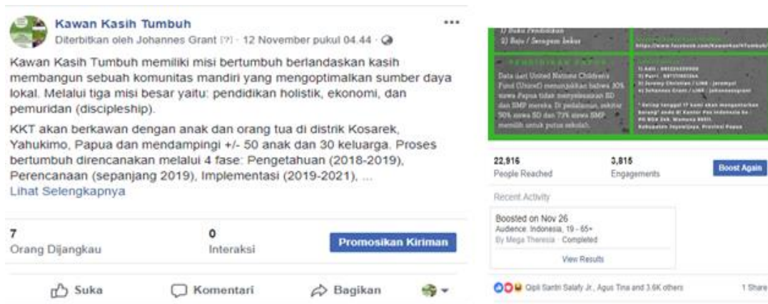
Gambar 7. Perbandingan sebelum dan setelah paid promote

Media sosial yang kedua adalah Instagram dengan alamat www.instagram.com/KawanKasihTumbuh seperti gambar 7. Semua unggahan konten dalam instagram berupa kegiatan-kegiatan keseharian yang dilakukan oleh komunitas Kawan Kasih Tumbuh (KKT) di Papua.