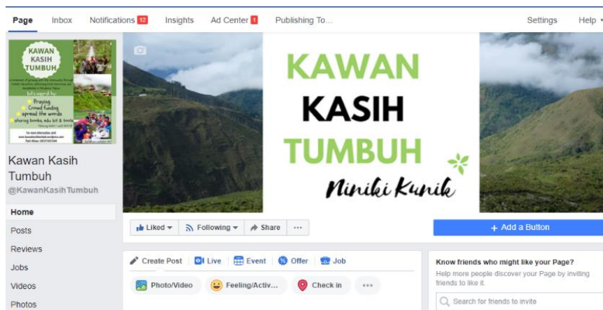
Gambar 6. Profile page Facebook Kawan Kasih Tumbuh (KKT)

Seperti yang sudah disebutkan sebelumnya, media sosial yang dibuat adalah Facebook dan Instagram dengan nama akun @KawanKasihTumbuh. Media sosial yang pertama adalah Facebook Page dengan alamat www.facebook.com/KawanKasihTumbuh seperti gambar 6. Semua unggahan konten dalam halaman ini disesuaikan dengan informasi di dalam website.