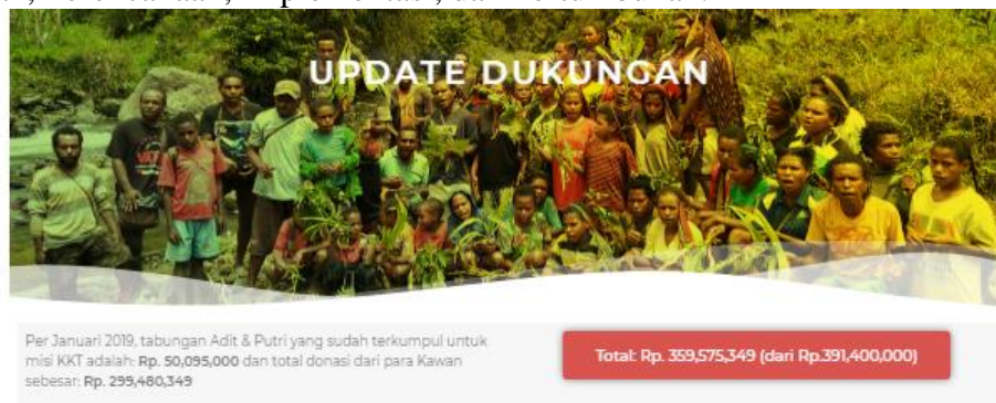
Gambar 10. Update dukungan dana

Gambar 9 menunjukkan bahwa total donasi yang diperlukan oleh Kawan Kasih Tumbuh (KKT) adalah sejumlah Rp 391.400,000. Dana tersebut dibutuhkan untuk mendukung operasional gerakan Kawan Kasih Tumbuh (KKT) yang akan dilaksanakan dalam fase Pengetahuan, Perencanaan, Implementasi, dan Pertumbuhan.