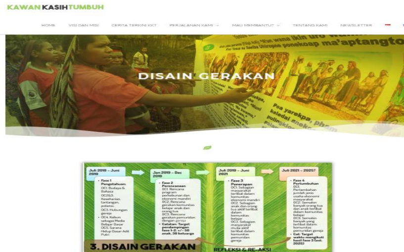
Gambar 5. Halaman Perjalanan Kami Website Kawan Kasih Tumbuh (KKT)

Seperti yang sudah disebutkan sebelumnya, media sosial yang dibuat adalah Facebook dan Instagram dengan nama akun @KawanKasihTumbuh. Media sosial yang pertama adalah Facebook Page dengan alamat www.facebook.com/KawanKasihTumbuh seperti gambar 6. Semua unggahan konten dalam halaman ini disesuaikan dengan informasi di dalam website.