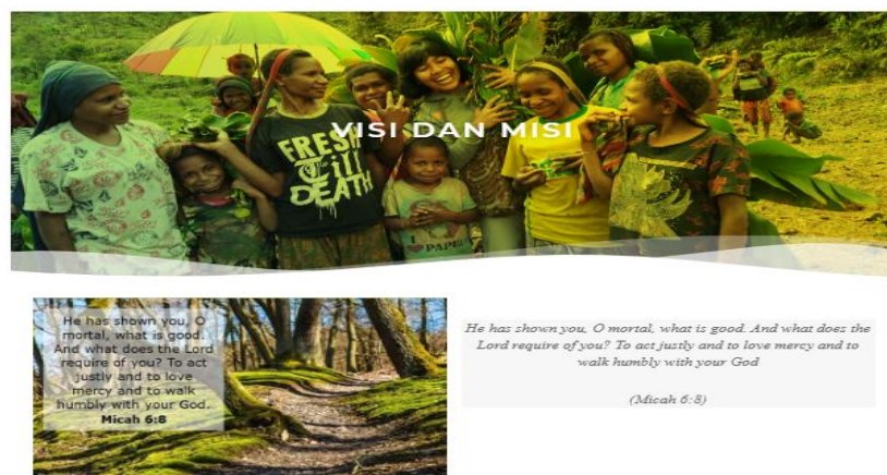
Gambar 4. Halaman Visi Misi Website Kawan Kasih Tumbuh (KKT)