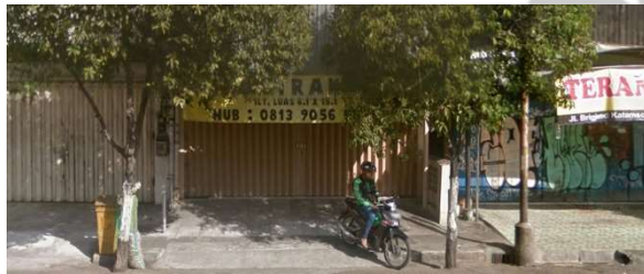
lokasi evaluasi 14b