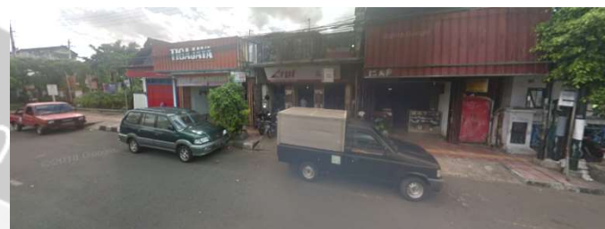
lokasi evaluasi 1t