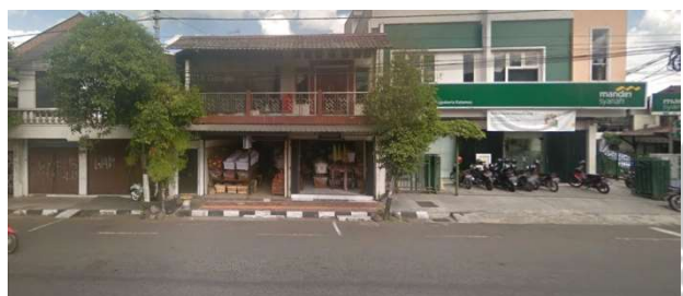
lokasi evaluasi 10b