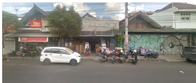
lokasi evaluasi 4b