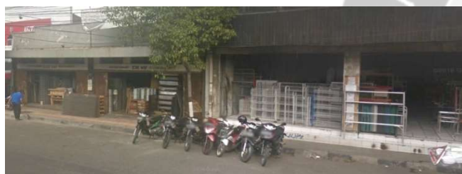
lokasi evaluasi 8b