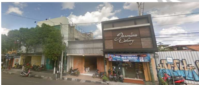
lokasi evaluasi 9b