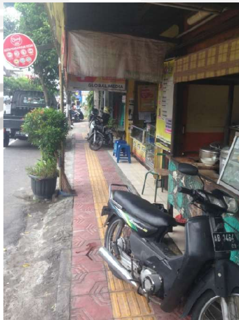
Gambar L.4 Pada Lokasi 02 Timur terdapat kendaraan yang terparkir di trotoar