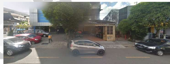
lokasi evaluasi 11t