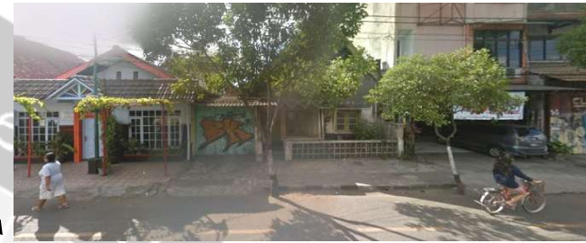
lokasi evaluasi 13t