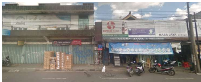
lokasi evaluasi 7b