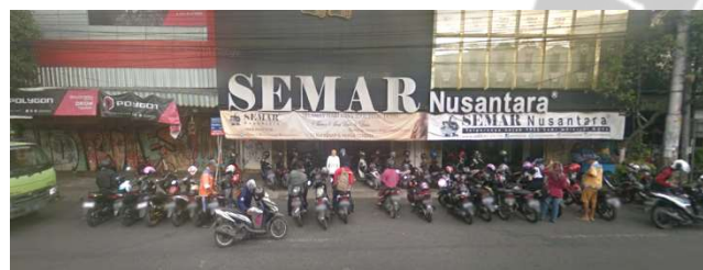
lokasi evaluasi 5b