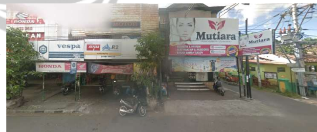
lokasi evaluasi 12t ( lokasi penelitian 03 timur )