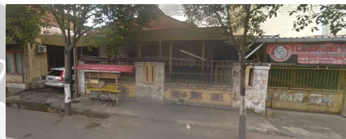
lokasi evaluasi 4t