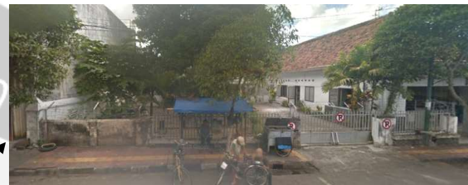
lokasi evaluasi 7t (lokasi pengamatan 02 timur)