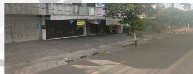
lokasi evaluasi 14t