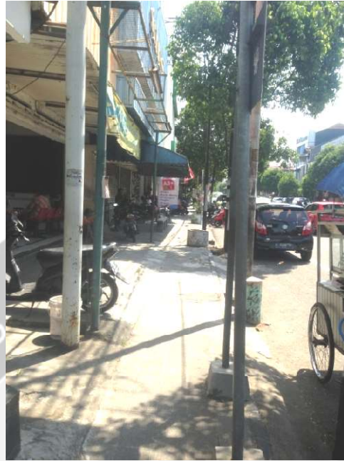
Gambar L.7 Pada Lokasi 03 Barat terdapat street furniture (perabot jalan) yang berupa rambu, tiang listrik dan pot yang menghalangi sirkulasi pejalan kaki