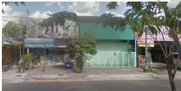
lokasi evaluasi 15b