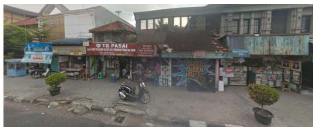
lokasi evaluasi 1b