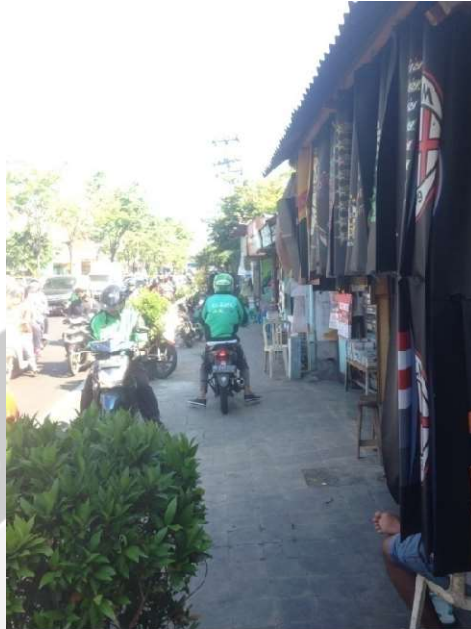
Gambar L.1 Pada Lokasi 01 Barat terlihat ojek online dan warga menaiki trotoar dengan motor untuk menunggu jemputan saat waktu pulang sekolah