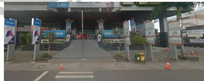
lokasi evaluasi 6t