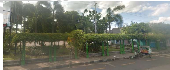
lokasi evaluasi 9t