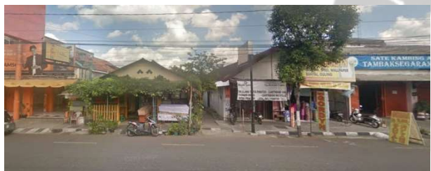
lokasi evalasi 11b