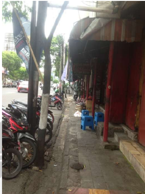
Gambar L.3 Pada Lokasi 02 Barat terdapat perabot toko maupun kendaraan yang berada di trotoar