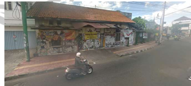
lokasi evaluasi 15t