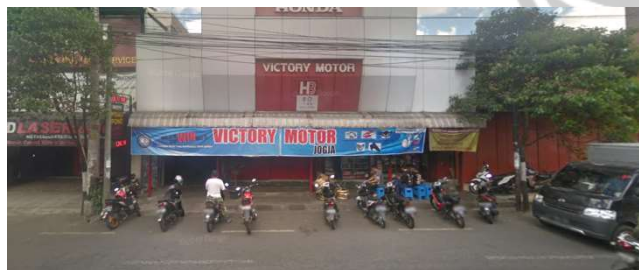
lokasi evaluasi 6b ( lokasi penelitian 02 barat )