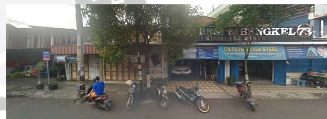
lokasi evaluasi 5t