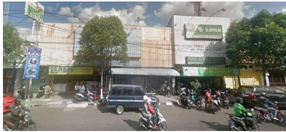
lokasi evaluasi 13b ( lokasi penelitian 03 barat)