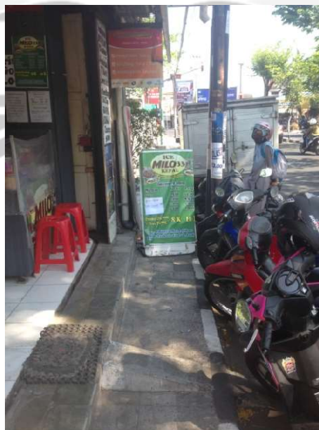
Gambar L.2 Pada Lokasi 01 Timur terdapat papan iklan yang menutupi trotoar, tanjakan kecil yang di buat di badan trotoar, juga terdapat parkir badan jalan.