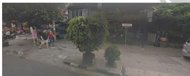
lokasi evaluasi 3b