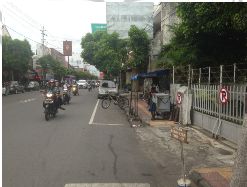
Gambar L.6 Lokasi 02 Timur terdapat PKL yang menggunakan trotoar