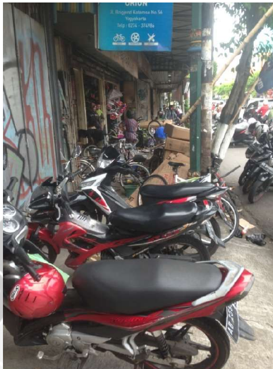
Gambar L.5 Lokasi 02 Barat terdapat kendaraan bermotor yang parkir diatas trotoar dan terdapat barang dagangan toko yang diletakan di trotoar