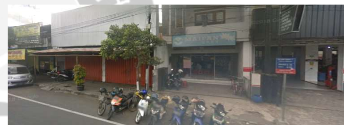
lokasi evaluasi 8t