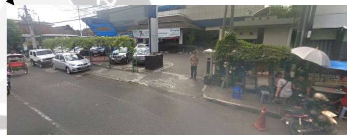
lokasi evaluasi 2t