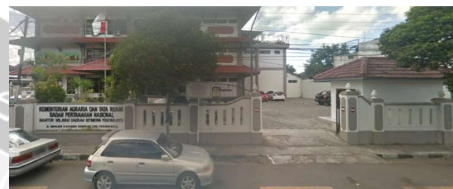
lokasi evaluasi 10t