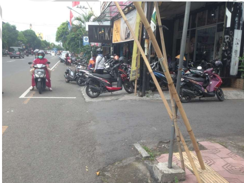
Gambar L.8 Lokasi 03 Timur terdapat trotoar yang mengalami pengalihan fungsi menjadi area parkir kendaraan