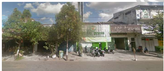
Lokasi evaluasi 12b