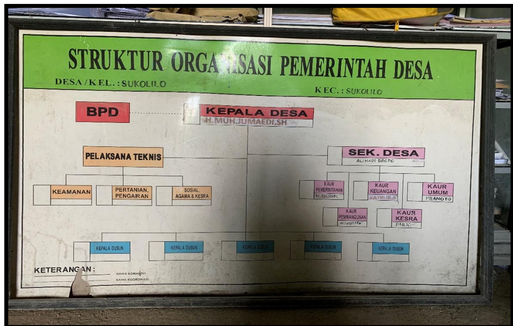
Ket: Susunan Organisasi Pemerintah Desa Sukolilo