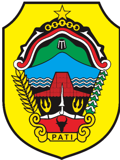
Ket: Logo Kabupaten Pati