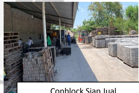
Conblock Siap Jual