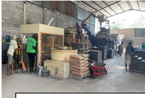
Mesin Paving Perusahaan