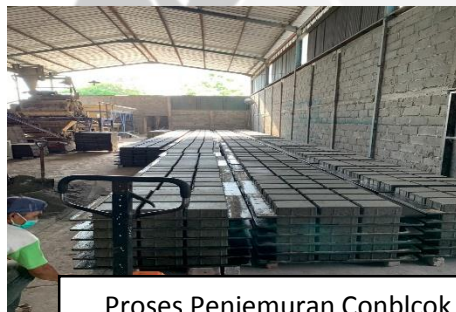
Proses Penjemuran Conblock