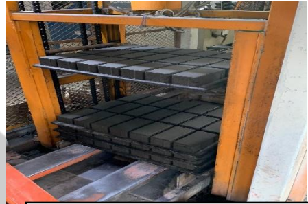
Hasil Mentah Conblock