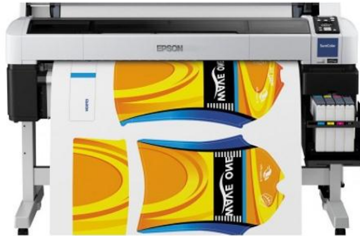
Keterangan Gambar :