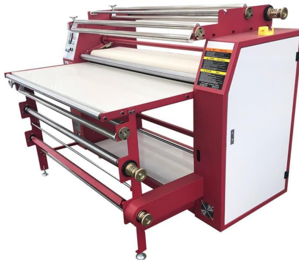
Keterangan Gambar :