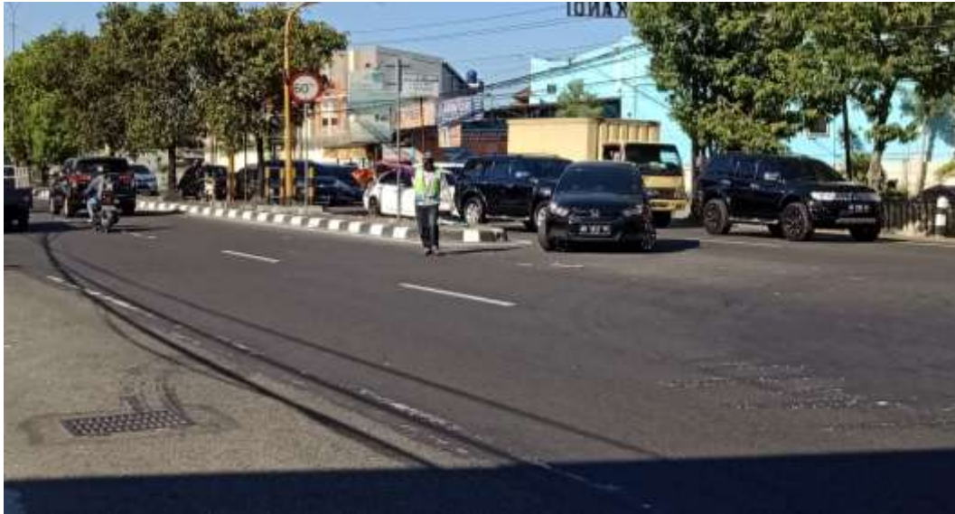
Lampiran Gambar Panjang Antrian Kendaraan yang Akan Memutar