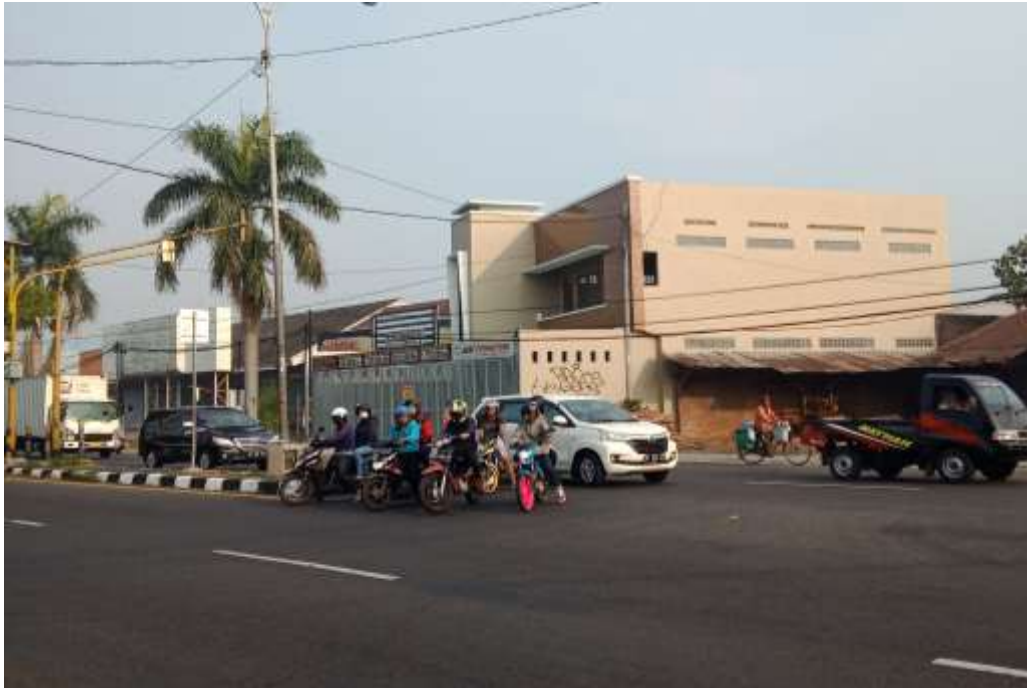
Lampiran Gambar Kendaraan yang Memutar Arah