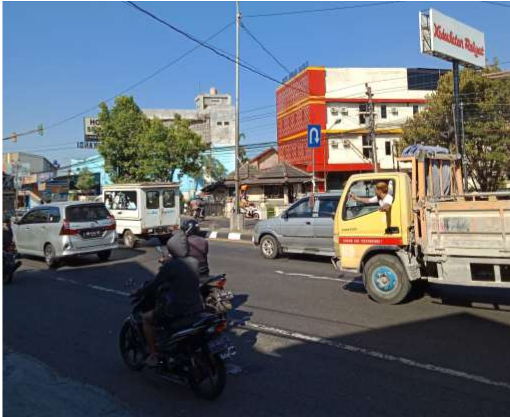
Lampiran Gambar Kondisi Lalu Lintas Arah Barat ke Timur