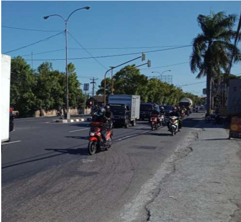
Lampiran Gambar Kondisi Lalu Lintas Arah Timur ke Barat