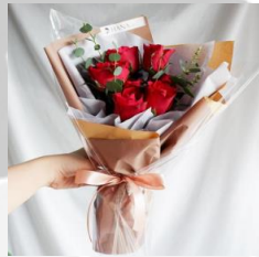
Petite Rose Bouquet 2