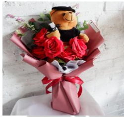
Graduation Bouquet S