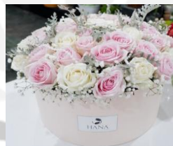
Rose Bloom Box