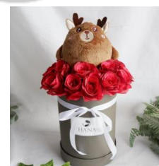
Blossom Box + Boneka