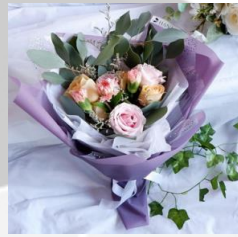
Cheer Up Bouquet