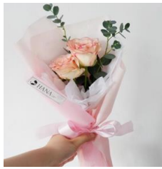
Mini Twin Bouquet