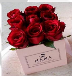
Petite Box S