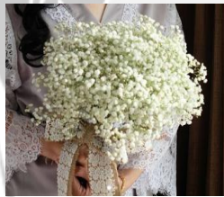
Baby's Breath Bouquet