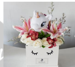
Petite Lily Box