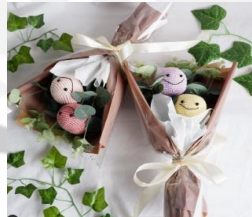
Mini Doll Bouquet