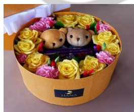
Surprise Box 1