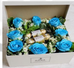
Ferrero Rose Box