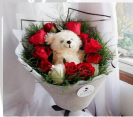
Sweet Teddy Bouquet