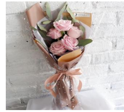
Petite Rose Bouquet 1