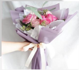
Rustic Sweet Bouquet