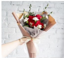
Simple Mix Bouquet