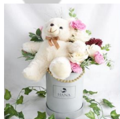
Sweet Love Box