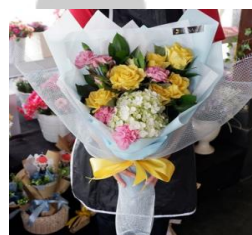
Hydrangea Mix Bouquet