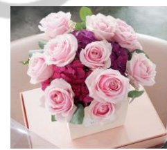
Petite Mix Box