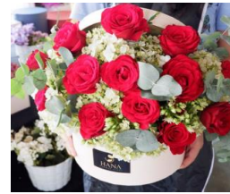
Mix Bloom Box