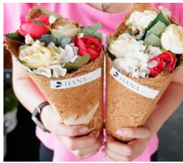
Mini Cone Bouquet