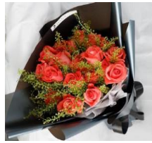
Full Roses Bouquet