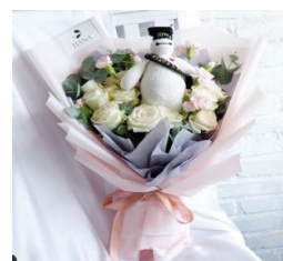
Sweet Dolly Bouquet