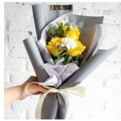
Mini Mix Bouquet