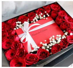
Surprise Box 2