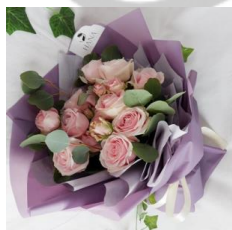
Rossie Bouquet 2