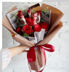
Mini Surprise Bouquet