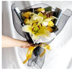
Lily and Rose Bouquet