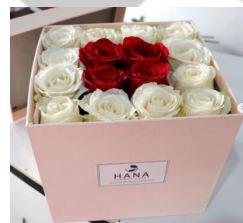
Petite Box M