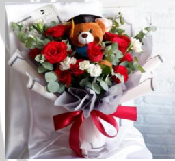
Graduation Bouquet M