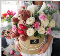
Lily Bloom Box