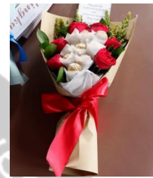
Ferrero Flower Bouquet