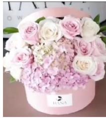
Classic Bloom Box