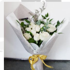
Rossie Bouquet 1