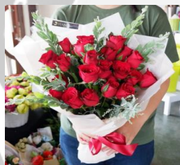
Grande Rose Bouquet