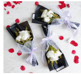
Mini Rose Bouquet