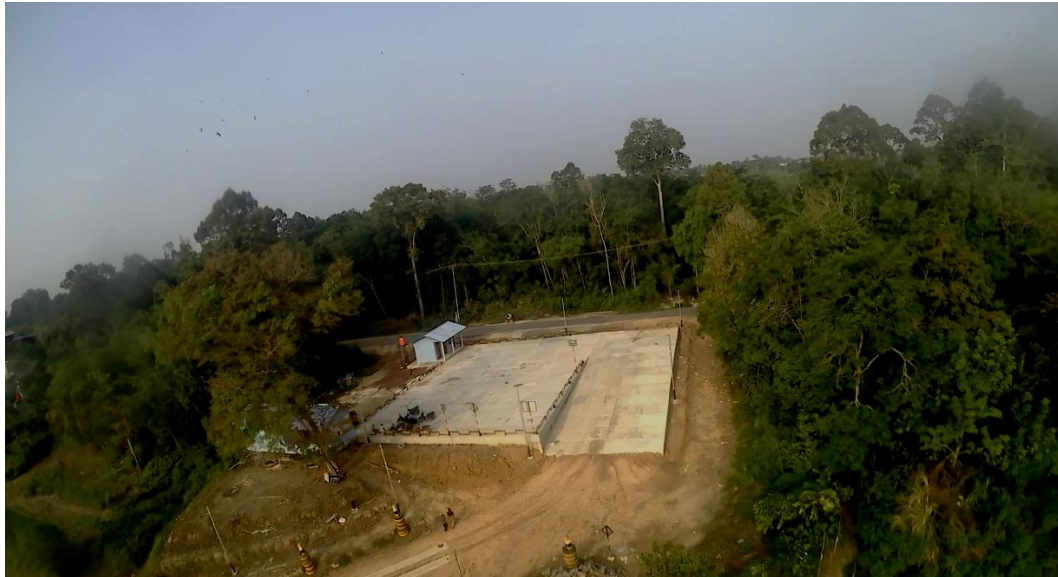
Dermaga PAM, Desa Sungai Ayak