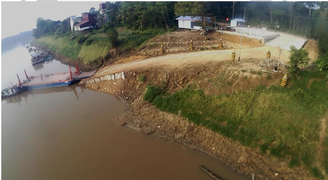
Dermaga PAM, Desa Sungai Ayak