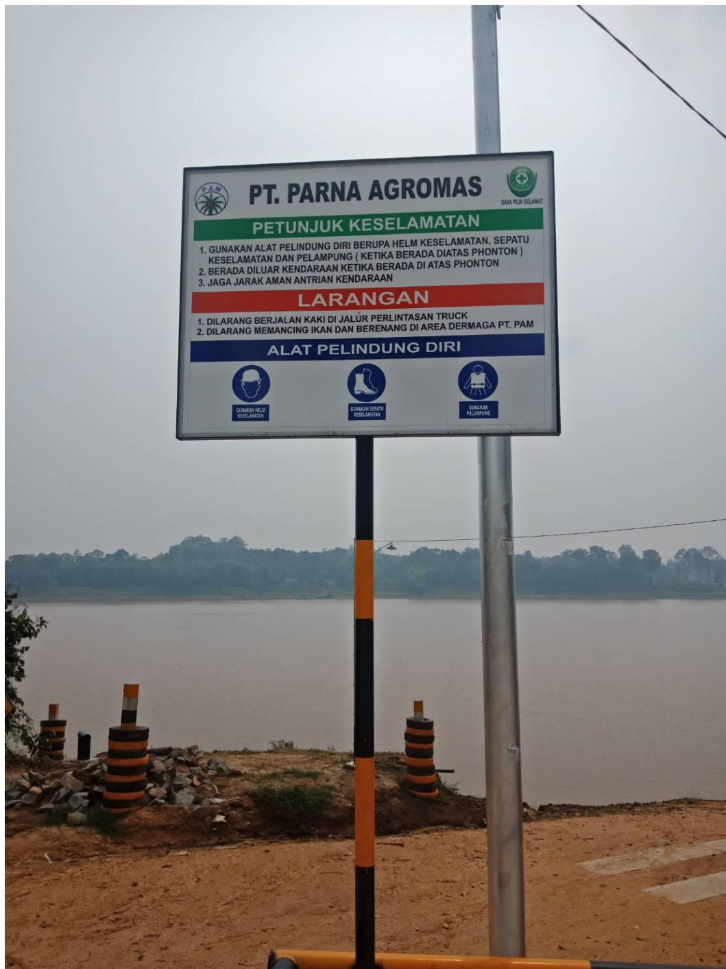
Plang petunjuk keselamatan dan larangan di Dermaga PAM