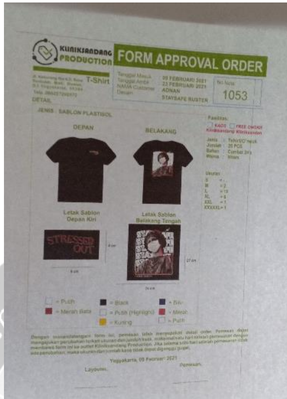
Contoh Approval Pesanan Kaos Sablon