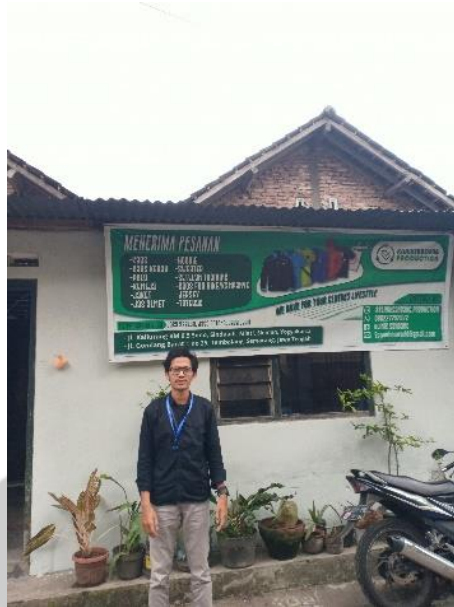
Pemilik UMK Kliniksandang Production