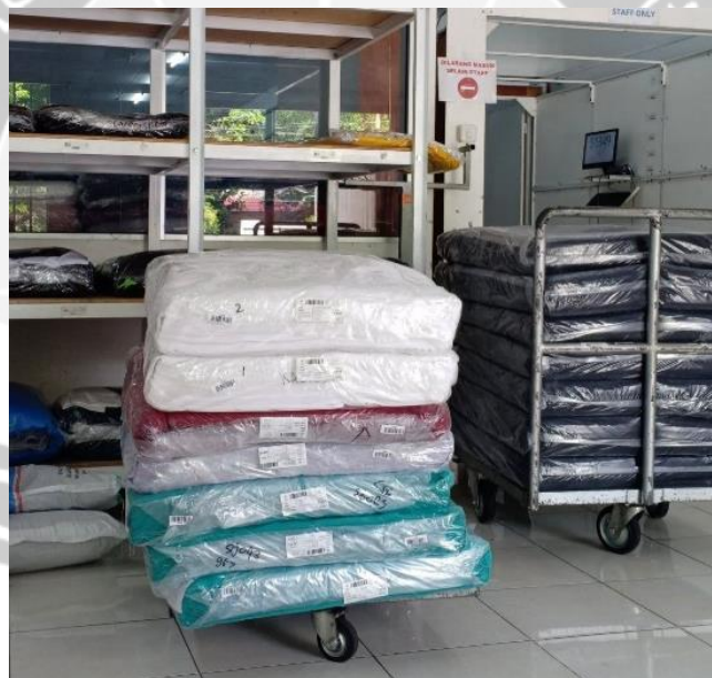
Pemesanan Kain di Knitto Yogyakarta