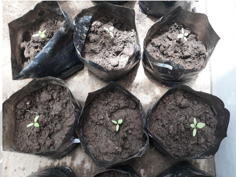
Gambar 2. Hari ke-0 tanaman bayam hijau