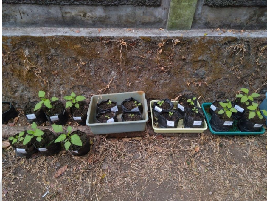
Gambar 5. Hari ke-16 tanaman bayam hijau