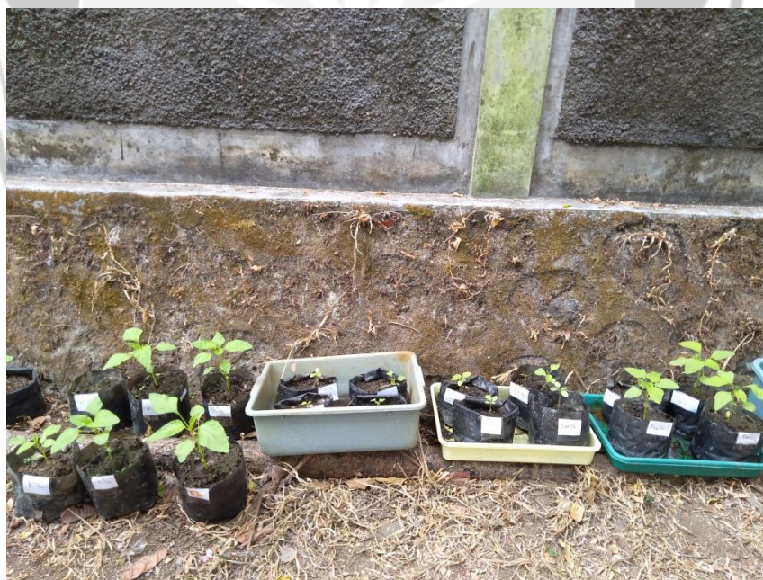
Gambar 4. Hari ke-12 tanaman bayam hijau