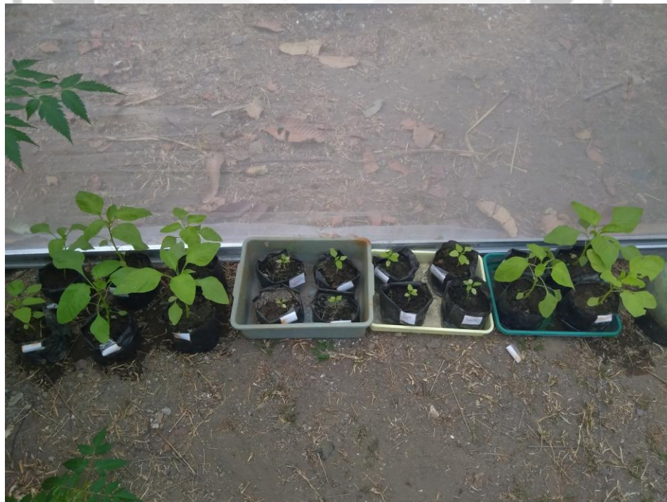
Gambar 6. Hari ke-20 tanaman bayam hijau)