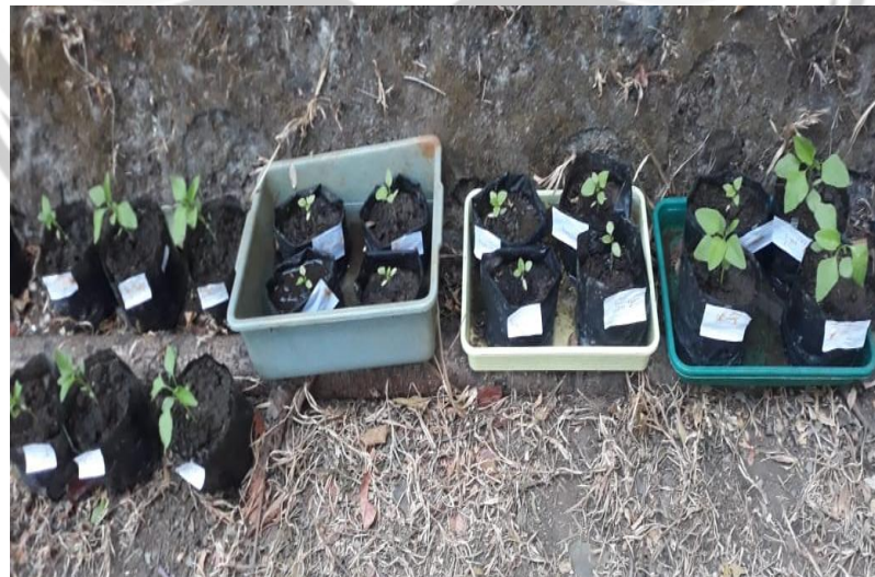
Gambar 2. Hari ke-4 tanaman bayam hijau