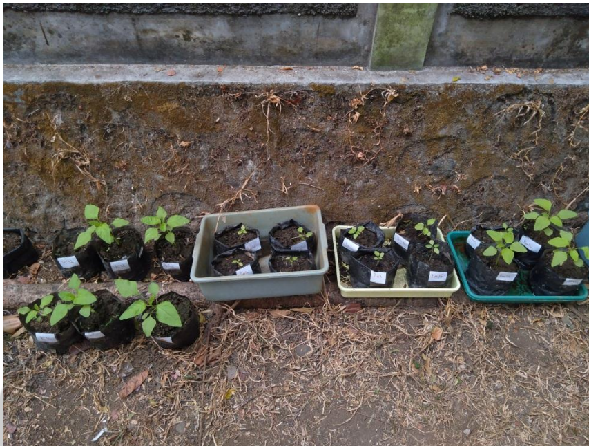
Gambar 3. Hari ke-8 tanaman bayam hijau