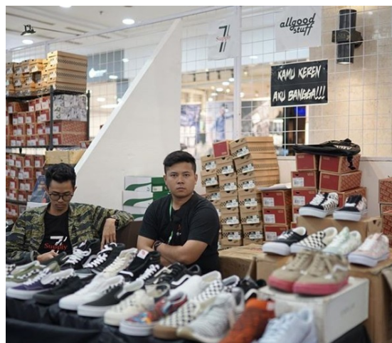
Gambar 2.7. Salah satu stand di acara Sole Vacation

Sneakers exhibition berupa pameran sneakers untuk brand-brand sneakers lokal yg dikurasi sedemikian rupa dalam rangka pemberdayaan brand sneakers lokal juga sebagai wadah bagi para sneakers resellers .