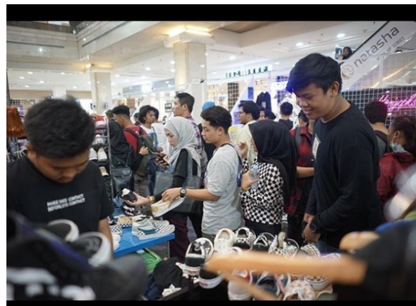
Gambar 2.4. Sneakers Market