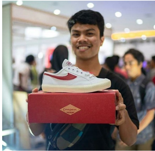
Gambar 2.6. Salah satu brand sepatu lokal yaitu Kompas