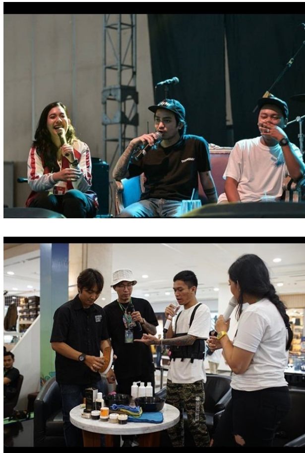
Gambar 2.5. Talkshow