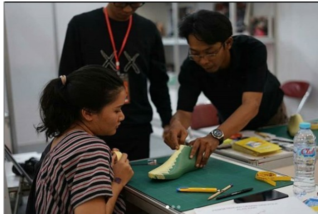
Gambar 2.8. Workshop Sneakers

Workshop sneakers custom dengan memberikan edukasi mengenai bagaimana cara mengetahui ukuran sepatu yang benar, bagaimana cara membuat sepatu, mengetahui bahan-bahan apa saja yang bagus untuk membuat sepatu, dan lain sebagainya.