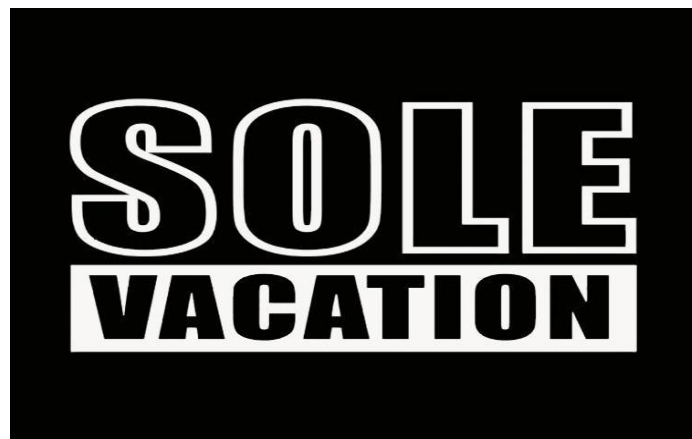
Gambar 2.1. Logo Sole Vacation