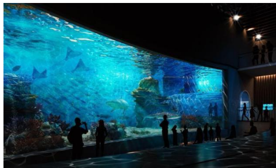
Gambar 2.4 Akuarium Dinding

Akuarium ini berisi biota-biota laut yang beragam dan mempunyai aneka bentuk yang sangat indah maupun bentuk-bentuk biota yang belum pernah ditemui oleh pengunjung karena hidup biota-biota laut yang ditampilkan ini sulit dijumpai langsung dan tidak terlihat dari permukaan air laut.