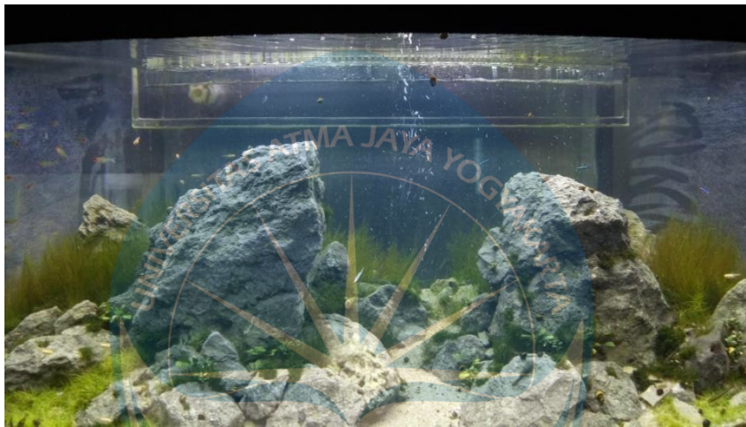
Gambar 2.9 Akuarium

Akuarium berasal dari bahasa latin yaitu aqua yang berarti air, dan rium yang berarti tempat. Definisi akuarium yaitu suatu tempat ikan, tanaman air, dan organisme air lainnya yang mempunyai minimal satu sisi transparan untuk dapat dilihat (Anonim, 2008). Menurut KBBI arti kata Akurium yaitu akuarium/aku·a·ri·um/ n bak kaca (biasanya diberi tanaman air dan sebagainya) tempat memelihara ikan hias.