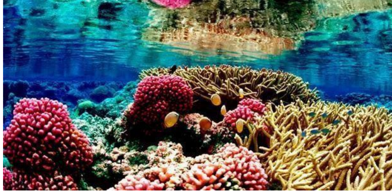
Gambar 2.2 Terumbu Karang dan Tanaman Laut