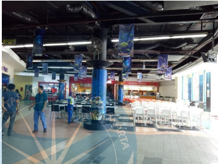
Gambar 2.18 Restoran Seaworld Ancol