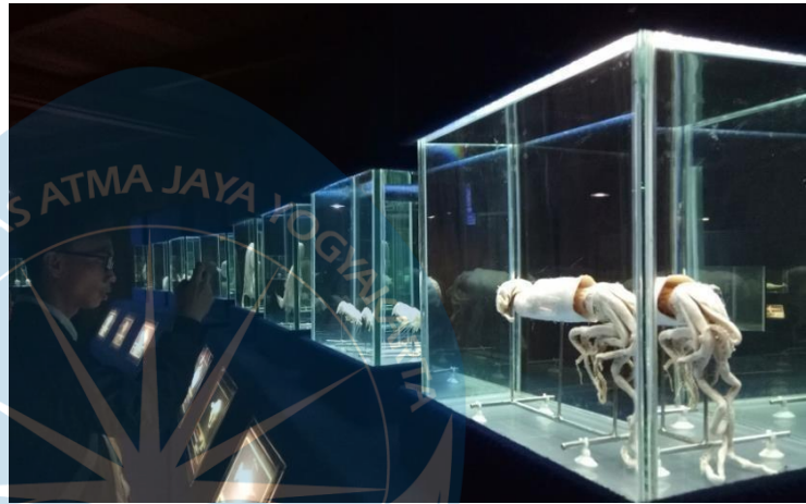
Gambar 2.20 Museum Seaworld Ancol