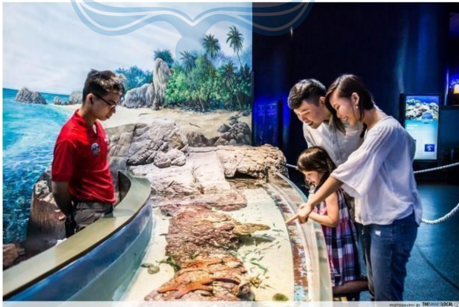
Gambar 2.7 Kolam Sentuh

Pada fasilitas ini pengunjung dapat berinteraksi langsung ,dapat lebih dekat dengan biota laut yang jinak, pengunjung dapat memegang dan memberi makan secara langsung kepada biota laut yang dipamerkan. Area kolam sentuh ini berisikan ikan-ikan dan penyu yang tidak membahayakan pengunjung.