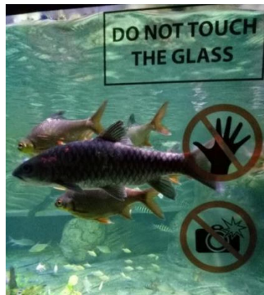
Gambar 2.16 Area Air Tawar Seaworld Ancol

Berisi satwa-satwa air tawar dari Indonesia dan juga dari berbagai negara, termasuk diantaranya piranha dan Arapaima gigas dari sungai Amazon. Akuarium air tawar yang ditampilkan menjadi beberapa tema-tema yang menarik antara lain, Aquarest (aquarium rain forest), Aquarapaima, Aquacar, Ex-Quarium, dan Aquarium piranha.