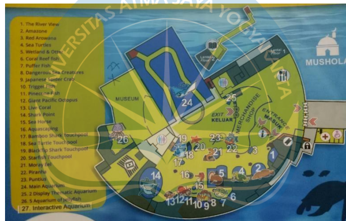
Gambar 2.14 Map Seaworld Ancol

Tata lanskap pada Sea World Indonesia disesuaikan dengan fungsinya sebagai bangunan yang memadahi biota air tawar dan air laut unsur-unsur laut diambil dan dimasukkan dalam keseluruhan tata lanskap. Terlihat pada bentuk kolom yang mengadaptasi pada bentuk karang dimana pada sisinya terdapat kuda laut yang memancarkan air, furniture dan sculpture mengadaptasi dunia bawah laut.