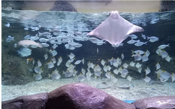
Gambar 2.1 Objek Pamer Biota Laut Hidup