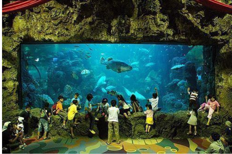
Gambar 2.15 Akuarium Utama Seaworld Ancol