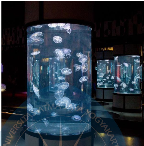
Gambar 2.3 Akuarium individu

ikan-ikan yang memiliki habitat di koral seperti ikan badut, ubur ubur. Akuarium ini biasanya berbentuk lonjong atau bulat keatas.