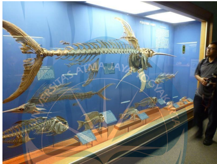
Gambar 2.8 Museum

Fasilitas ini berisikan biota-bota laut baik yang telah punah maupun yang masih ada di laut saat ini namun sangat jarang terlihat atau susah untuk diketahui keberadaanya dikarenakan habitatnya yang sulit di jangkau manusia. Penyajiannya berupa biota laut yang sudah mati lalu diawetkan dan di letakan pada lemari / akuarium kaca