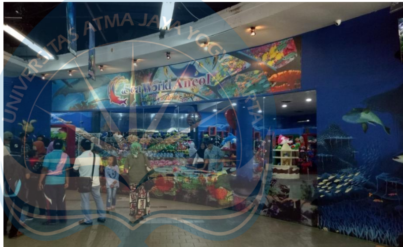
Gambar 2.19 Toko Souvenir Seaworld Ancol

Pengunjung juga dapat membeli berbagai cinderamata maupun perlengkapan yang berhubungan dengan SeaWorld , seperti aneka boneka biota laut, gantungan kunci, stiker, kaos, poster-poster yang bertemakan biota laut dan seaworld.