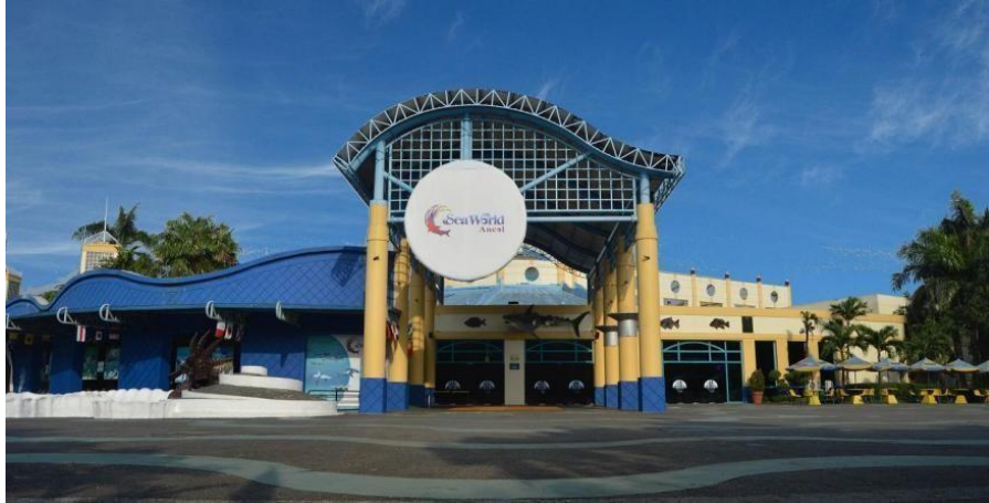
Gambar 2.13 Sisi Depan Seaworld Ancol