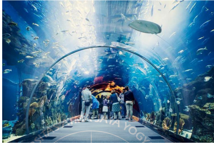
Gambar 2.5 Akuarium Utama

Akuarium Utama ini berisikan berbagai biota seperti hiu, ikan pari, penyu dan berbagai jenis kawanan ikan yang berkoloni menjadi satu dalam akuarium utama ini , menjadikan sebuah ekosistem laut yang sangat indah.