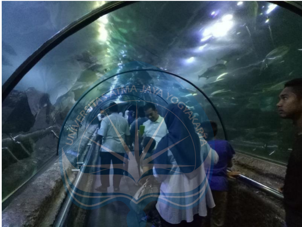
Gambar 2.17 Lorong Antasera Seaworld Ancol

lorong bawah air sepanjang 80 m yang dioperasikan dengan pijakan berjalan otomatis dengan kubah tembus pandang. Memungkinkan pengunjung untuk menikmati pemandangan bawah laut tanpa harus khawatir tersandung saat menengadah ke atas untuk melihat ikan.