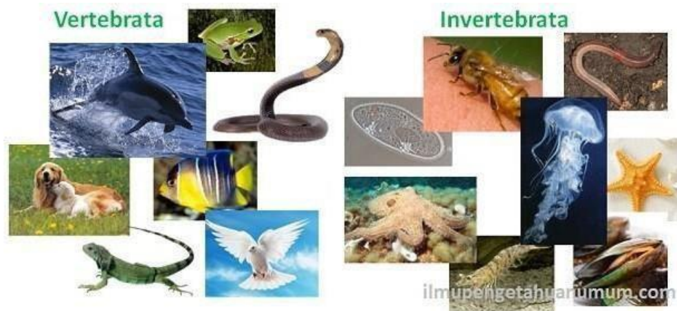
Gambar 2.11 Klasifikasi Hewan