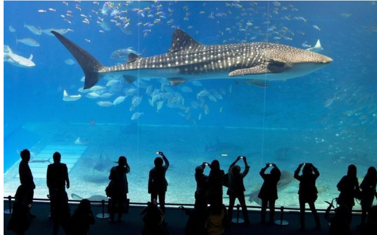
Gambar 2.6 Akuarium Hiu