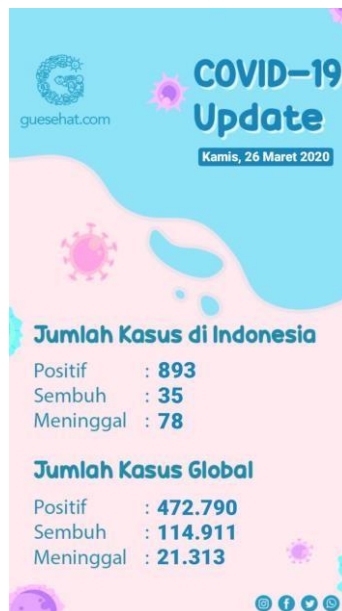
Gambar 2.3: Update data Covid-19