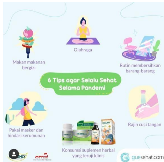
Gambar 2.5: Tips Pandemi Covid-19