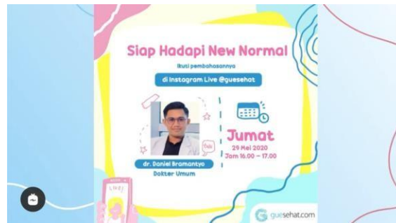
Gambar 2.4: Live Instagram

Instagram @guesehat selama masa pandemi Covid-19 juga rutin mengadakan live Instagram untuk membahas informasi terkait pandemi Covid-19. Informasi yang dibahas antara lain tips untuk menghadapi new normal, kesehatan mental ketika pandemi, penerapan hidup bersih dan sehat di masa pandemi, dan lain-lain. Live Instagram @guesehat mengundang dokter-dokter yang ahli dibidangnya untuk menjadi pembicara agar informasi yang diberikan kredibel. Selain mendengarkan informasi dari pakar secara langsung, followers juga bisa mengajukan pertanyaan seputar topik yang sedang dibahas dan akan dijawab secara langsung oleh pakar tersebut.