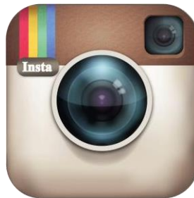
Gambar 2.1: logo Instagram tahun 2012

Instagram merupakan aplikasi sosial yang berkembang pesat sejak tahun 2012. Instagram merupakan salah satu aplikasi media digital yang memiliki kegunaan untuk membagikan informasi dalam bentuk foto atau video kepada penggunanya (Untari dan Fajriana, 2018:274). Instagram berasal dari kata “insta” yang berarti “instan” dan “gram” yang diambil dari aplikasi “telegram”. Gambaran ini merujuk pada kamera polaroid yang menghasilkan “foto instan” dan cara kerjanya yang seperti telegram, yaitu mampu menyebarkan informasi secara cepat dan luas.