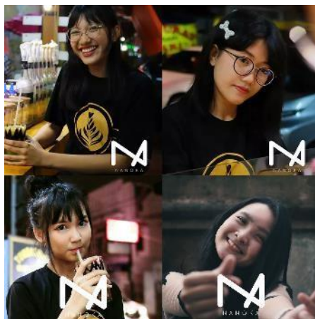
Gambar 3 Anggota NANOKA generasi kedua