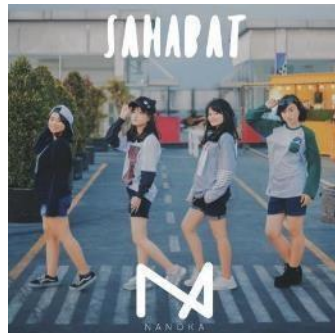
Gambar 6 Cover art single Sahabat