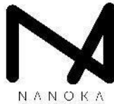
Gambar 1 Logo NANOKA