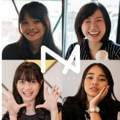
Gambar 2 Anggota NANOKA generasi pertama