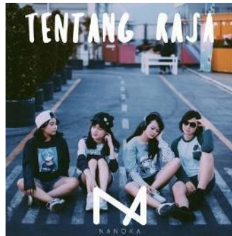
Gambar 7 Cover art single Tentang Rasa