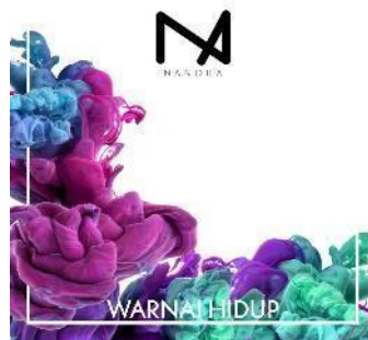
Gambar 5 Cover art single Warnai Hidup