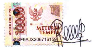
Risca Bonita Siokain