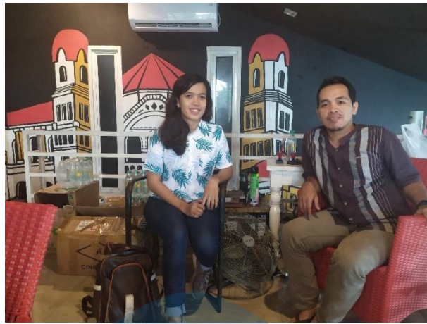
Lampiran 8 : Transkrip Hasil Wawancara dengan Direktur Toko Aksesoris Handphone