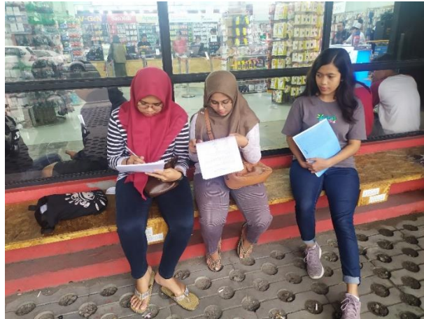
Lampiran 6 : Dokumentasi Penyebaran Kuesioner di Toko Aksesoris Handphone