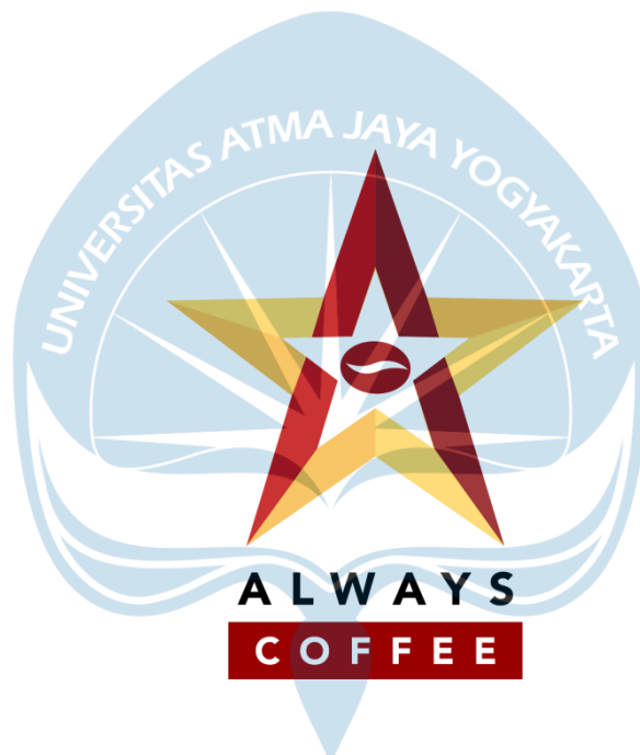
GAMBAR 1 Logo Always Coffee

Logo Always Coffee memiliki bentuk bintang yang dipadukan dengan warna merah dan kuning. Arti bintang pada logo adalah bintang yang selalu bersinar dengan harapan akan bersinar di dunia perkopian. Warna merah melambangkan kekuatan yang memberikan energi dan kegembiraan. Warna kuning melambangkan kekuatan yang memberikan energi dan kegembiraan. Warna kuning melambangkan kehangatan yang mengandung makna optimis, semangat, dan ceria.