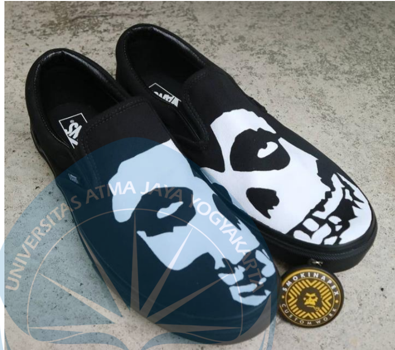
Gambar 2.3 Lukisan pada Sepatu Pesanan Konsumen Smokinapex Custom Work