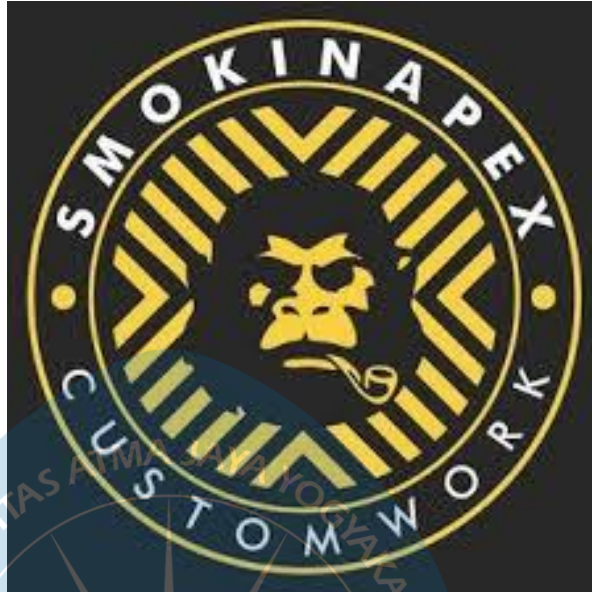
Gambar 2.1 Logo Smokinapex Custom Work