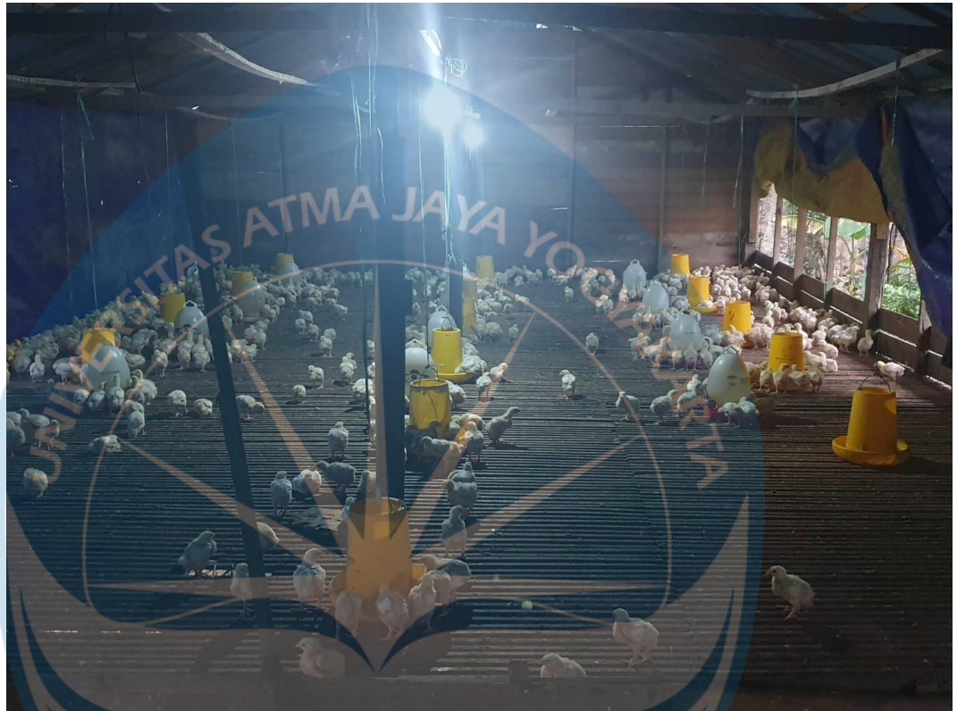
Lampiran : Kondisi Dalam Kandang ayam Peternakan Aciok