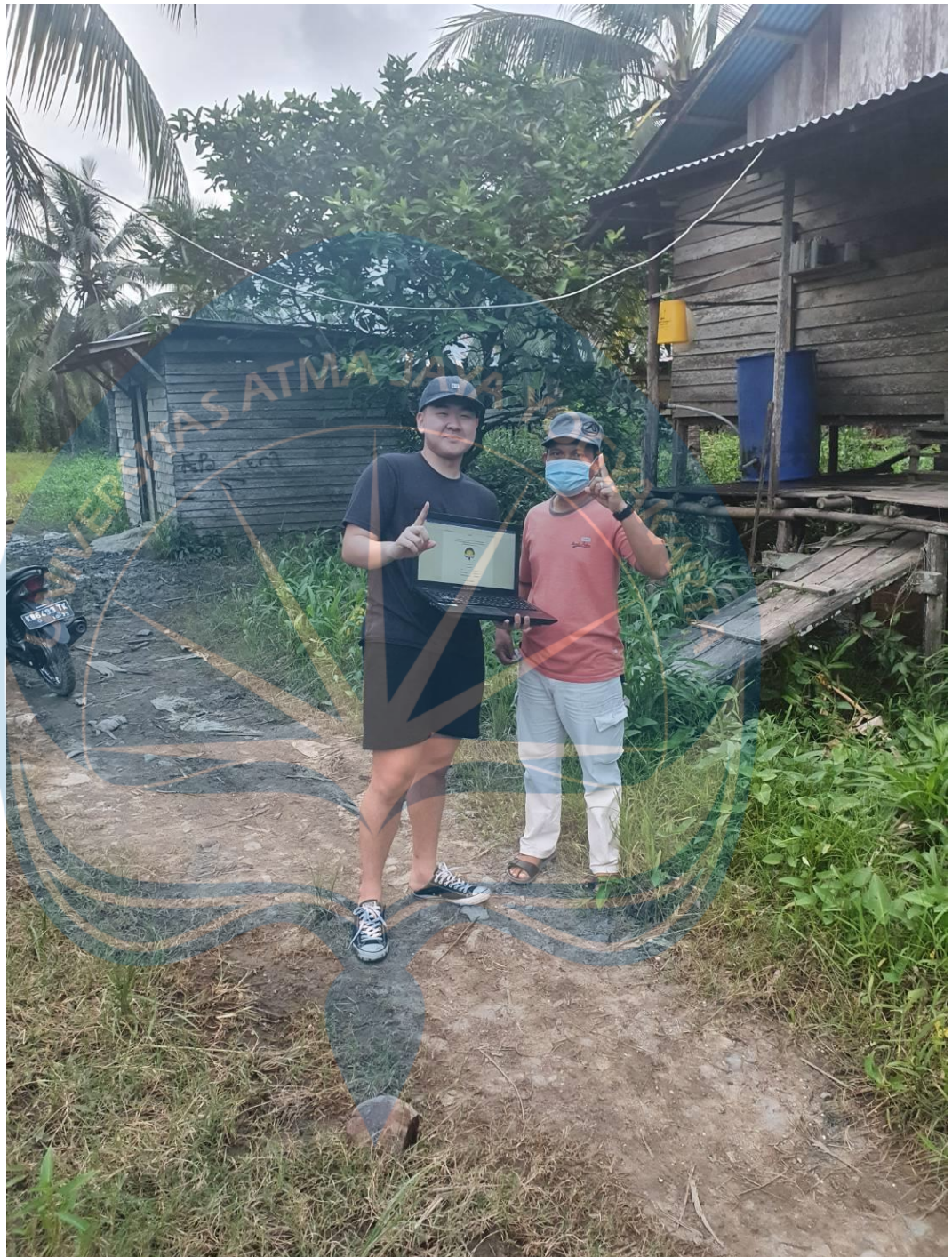
Lampiran : Foto di luar Peternakan Aciok