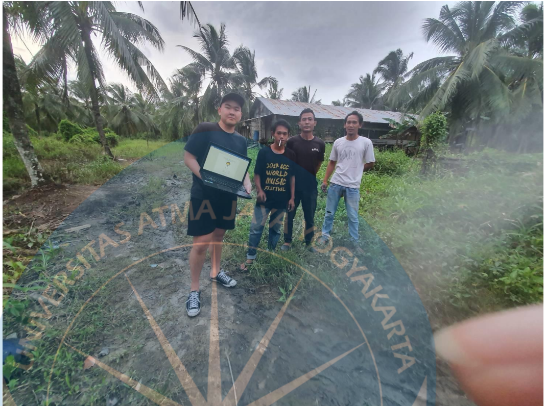
Lampiran : Foto Bersama Karyawan Peternakan Aciok