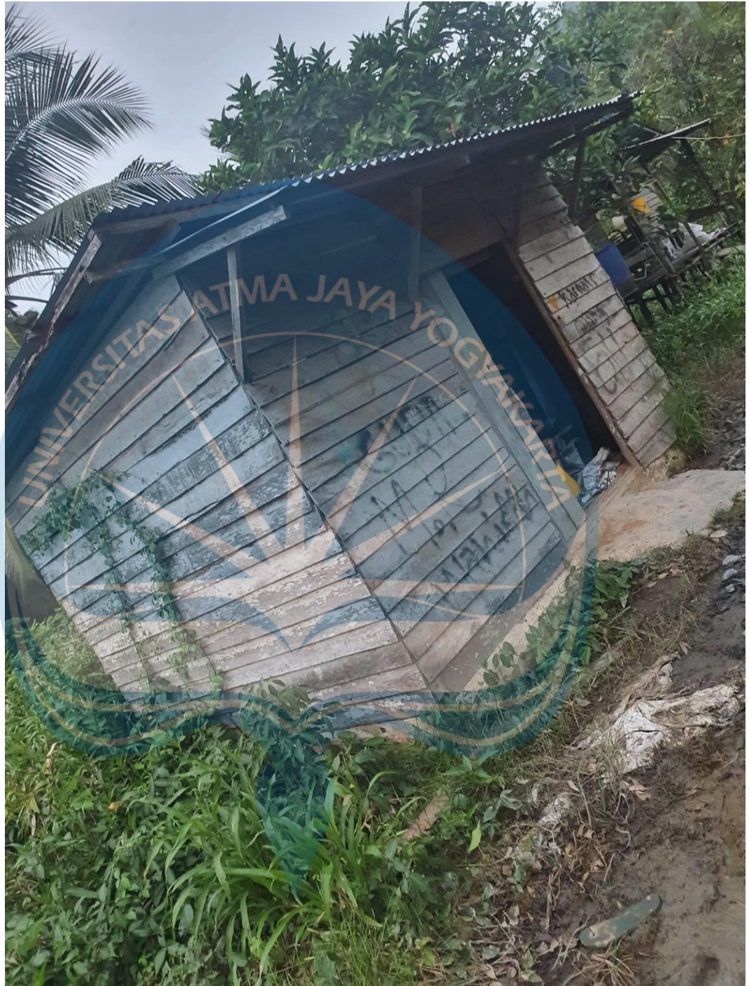
Lampiran : Gubuk tempat Penyimpanan makanan ayam.