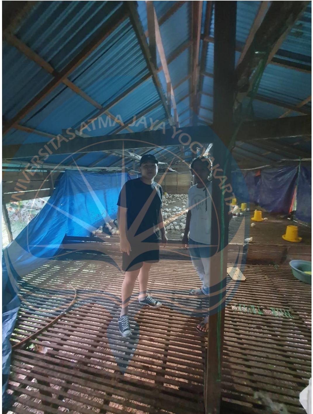
Lampiran : Foto Bersama Hendi Karyawan Peternakan Aciok