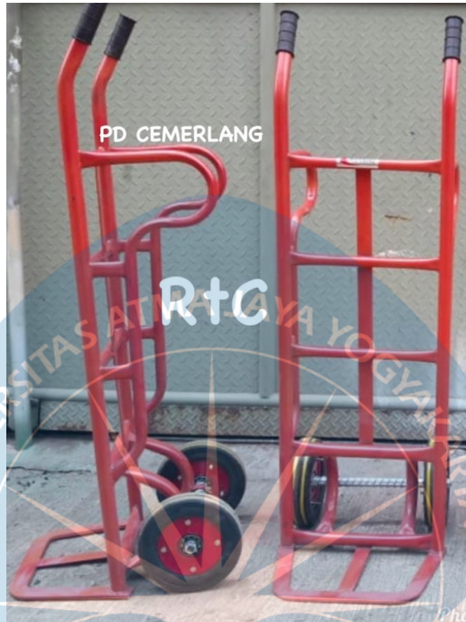
Gambar Material Handling Pilihan Peneliti