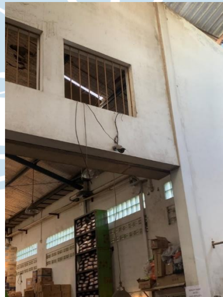
Gambar 6. CCTV di Area Gudang