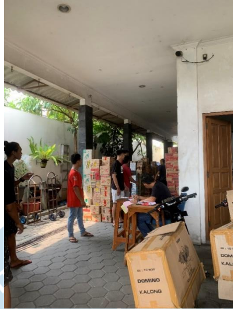
Gambar 3. Pimpinan sedang mengecek barang keluar