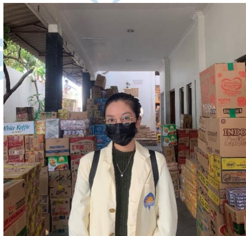
Gambar 2. Peneliti berfoto di depan area masuk CV