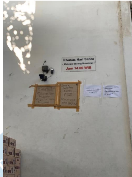
Gambar 5. CCTV di Area Gudang