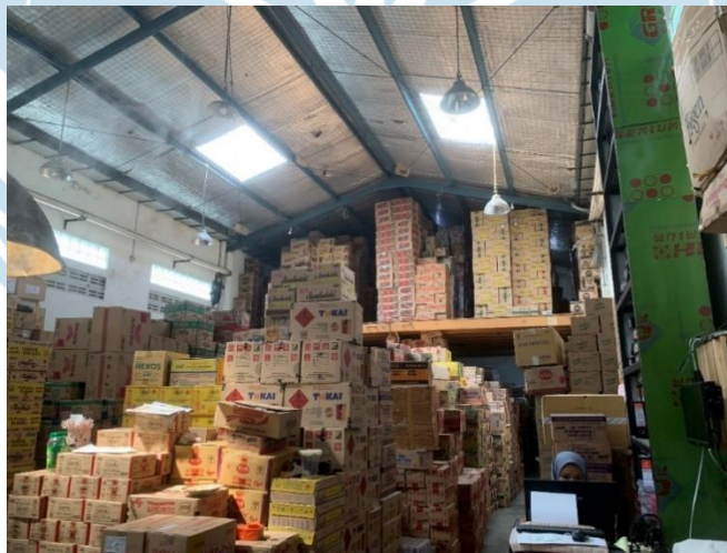
Gambar 4. Kondisi Gudang Utama