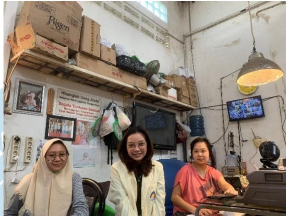
Gambar 1. Berfoto bersama Manager CV dan Karyawan Gudang