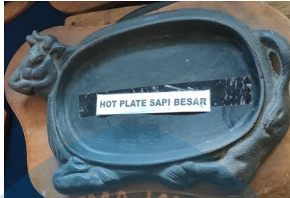
Foto Produk Hotplate Sapi Besar