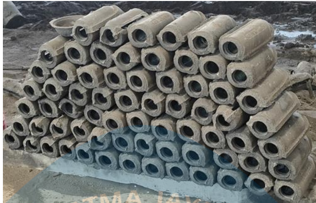
Foto Produk Sambungan Pipa PDAM