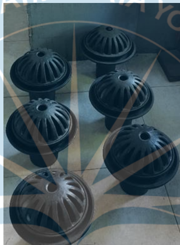
Foto Produk Roofdrain