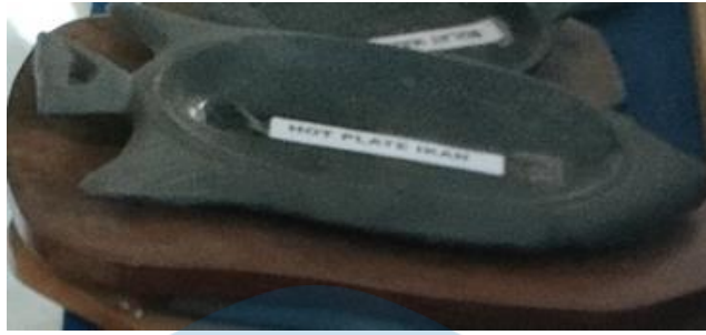
Foto Produk Hotplate Ikan