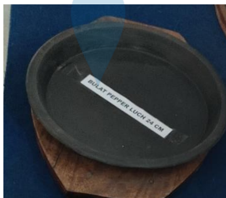
Foto Produk Hotplate Bulat