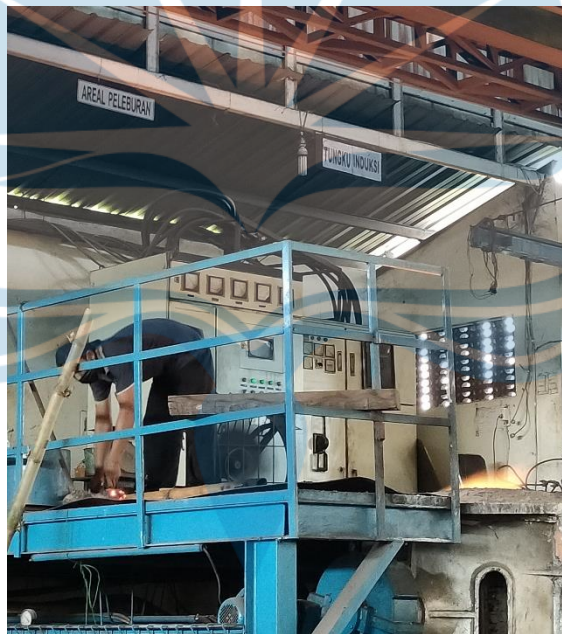
Foto Areal Peleburan Besi Skrap dan Tungku Induksi