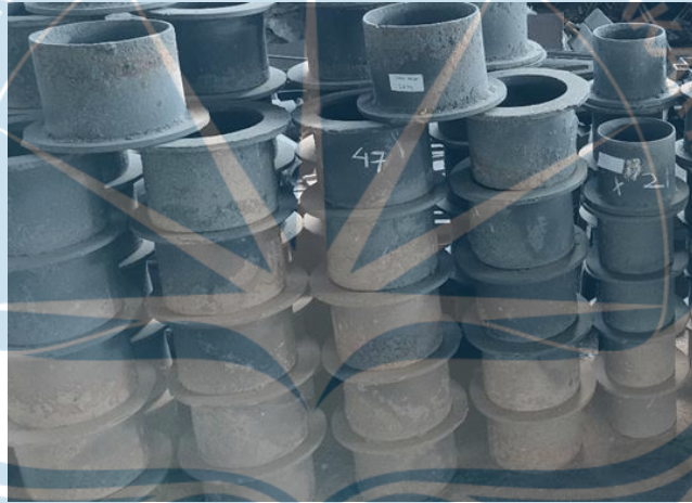
Foto Produk Socket Besi