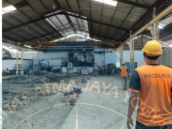
Foto Departemen Pengecoran Logam