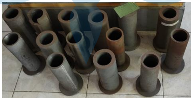
Foto Produk Sparepart Cylinder Sleeve